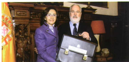
Arias Cañete recibió la cartera ministerial de manos de Rosa Aguilar.

finalmente apostar por la continuidad y confirmó la vuelta de Miguel Arias Cañete como máximo responsable del 'Caserón de Atocha'.