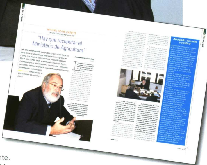
En Enero de 2010 publicamos una entrevista en exclusiva con Arias Cañete en la que dejó clara su opinión sobre la recuperación del Ministerio de Agricultura.

Pero el nuevo Presidente de Gobierno, Mariano Rajoy, que durante la campaña electoral también se comprometió a recuperar 'Agricultura' como referencia primera del Ministerio, decidió