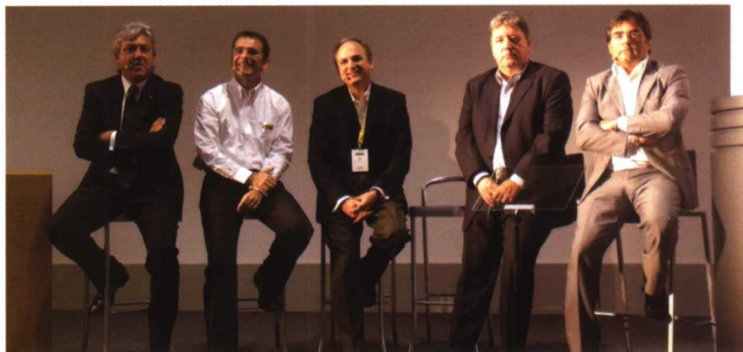
Los directivos de New Holland, durante la cita ante la prensa europea.

Como marca perteneciente al Grupo Fiat se ha trabajado y contado con la experiencia y sinergias de Fiat Powertrain Technologies (FPT) en el desarrollo de motores, empresa que también es la encargada de su producción. Este departamento fue el responsable de la invención del sistema por inyec-