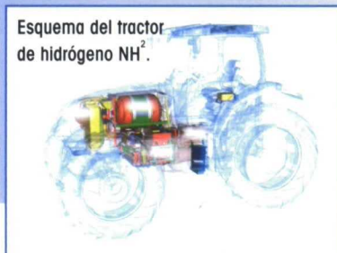
Esquema del tractor de hidrógeno NH^2 .

nocida como AdBlue para neutralizar el nocivo óxido de nitrógeno de las emisiones de escape y convertirlo en agua y nitrógeno inocuos, partículas que se encuentran de forma natural en el ambiente. El AdBlue supone un ahorro de hasta tres euros en combustible por cada euro invertido en este aditivo. New Holland ha realizado cálculos para la nueva gama T8 considerando que el coste del gasoil es de 0.58 €/L y que la solución AdBlue cuesta 0.35 €.