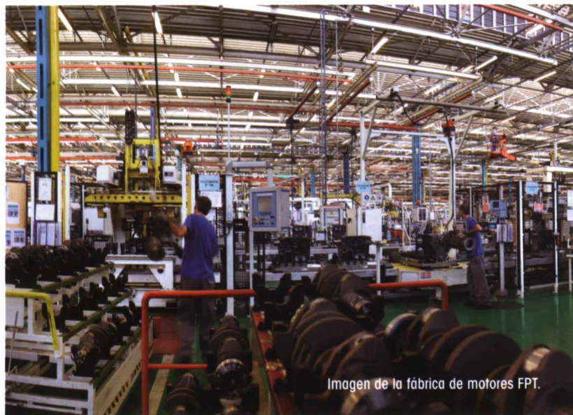
Imagen de la fábrica de motores FPT.

La normativa Tier 4A entrará en vigor a comienzos del 2011, mientras que la Tier 4B comenzará a aplicarse en el 2014. Los motores actuales contaminan mucho menos que sus predecesores. Los motores Tier 3 que se usan en la actualidad emiten un 60% menos partículas y óxido de nitrógeno (NOx) que sus homólogos Tier 1. La entrada en vigor de las restrictivas normas de emisiones Tier 4A supondrá una reducción de la emisión de partículas del 90% y de NOx del 50% con respecto a los niveles de la norma Tier 3. En términos reales significa que un agricultor puede trabajar casi 100 días con una máquina Tier 4A, ya que su nivel de emisiones equivale a un solo día de trabajo con una máquina Tier 1.