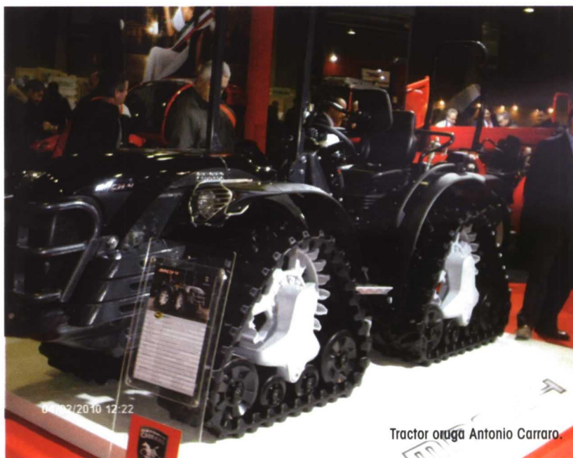
Tractor oruga Antonio Carraro.

La feria se estructura en salones temáticos comprendiendo cinco áreas: