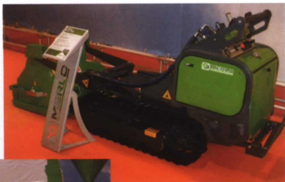
El grupo Merlo expuso los pequeños transportadores orugas Cingo.

constante de la población activa agrícola, ya que aumentan los trabajadores ocupados en los sectores dependientes de la misma agricultura, como industrias agrarias y alimentarias, energías renovables, agroturismo, etc.