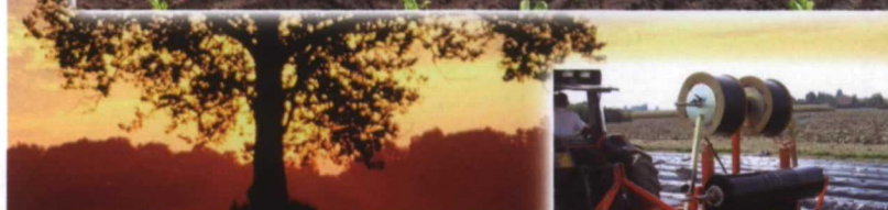
MAQUINAS PARA LA PATATAS