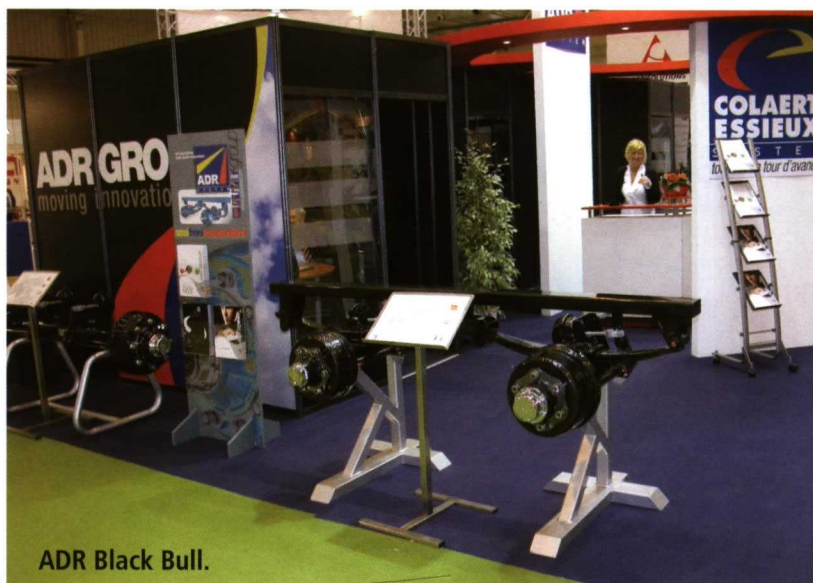
ADR Black Bull.

Hasta el más pequeño de los componentes tiene un valor fundamental para el fabricante de maquinaria agrícola. FIMA sigue siendo el lugar idóneo para 'ponerse al día' en lo que respecta a esta área del mercado.