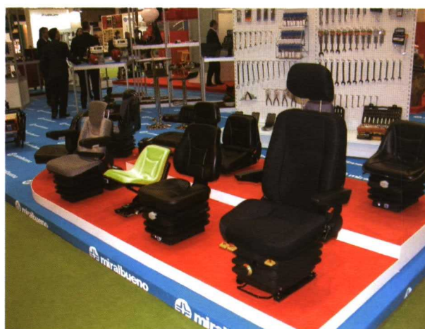
El stand del Grupo Miralbueno incluyó herramientas y sus conocidos asientos, entre otros productos.

acuerdo de colaboración con la firma holandesa.