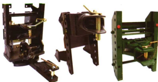
Los productos de Agrinava también estuvieron expuestos en FIMA.

Ortiz de Zárate presentó el Kit Kat Monosem. Se trata de un kit antideriva, fabricado para solucionar el problema del polvo volatilizado de los tratamientos insecticidas de las semillas en las sembradoras neumáticas. Está compuesto de un colector, de un tubo, de una caja de descompresión y de dos tubos de evacuación del aire hacia el suelo.