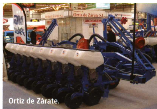
Ortiz de Zárate.

Ilemo Hardi dispone de un nuevo kit de aire XF para sus atomizadores Mercury. Este equipo produce caudales de aire de hasta 120 000 m 3 /h, con buen rendimiento energético.