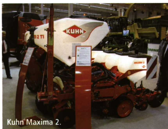
Kuhn Maxima 2.