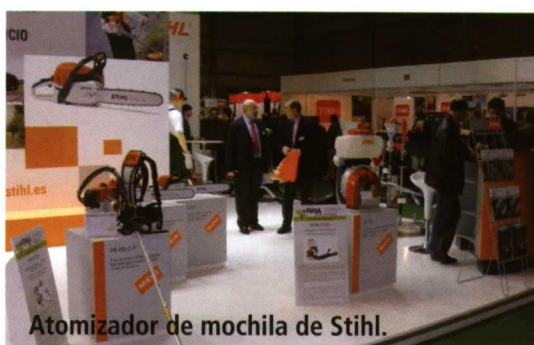
Atomizador de mochila de Stihl.

Una de las principales novedades de Stihl fue su atomizador de mochila SR 450, premiado en el