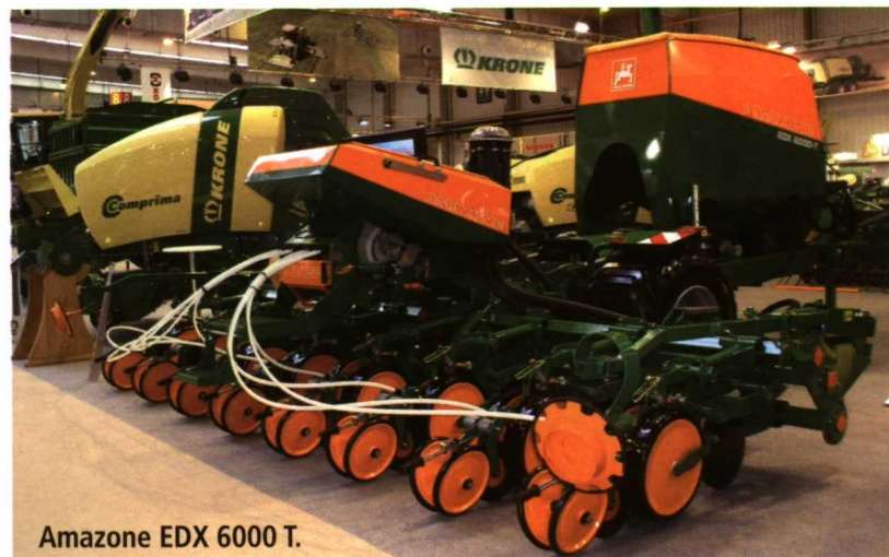
Amazone EDX 6000 T.