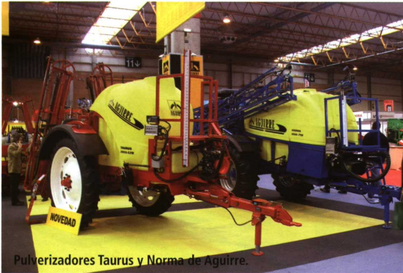
Pulverizadores Taurus y Norma de Aguirre.

Por otra parte, en el stand de Aguirre destacó un nuevo sistema de fertilización en microgánulo para sembradora neumática. Este dispositivo permite aplicar fertilizante en la línea de siembra.