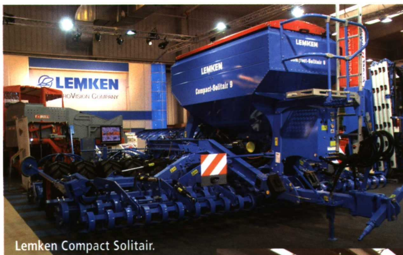
Lemken Compact Solitair.

Aguirre incluye como novedad en sus pulverizadores arrastrados Taurus (3 000 L) y Norma (4 000 L), nuevas barras de pul-