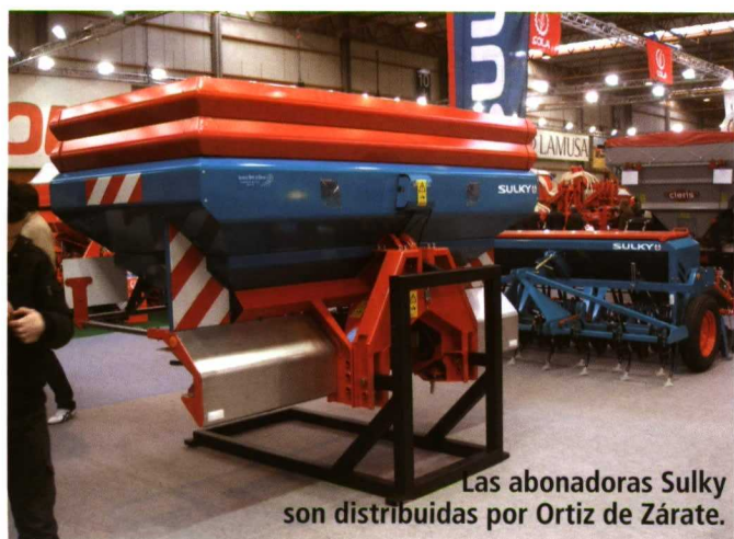
Las abonadoras Sulky son distribuidas por Ortiz de Zárate.

La división de pulverización de Vogel & Noot aportó como novedad en este segmento un nuevo pulverizador arrastrado MasterSpray EN 460, con capacidad del tanque de 4 600 L reales.