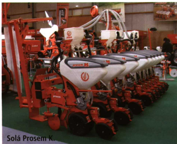
Solá Prosem K.