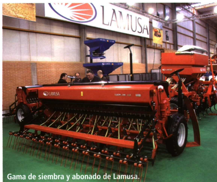
Gama de siembra y abonado de Lamusa.