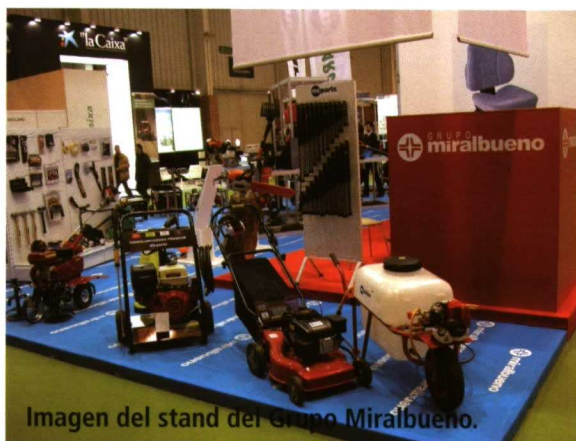
Imagen del stand del Grupo Miralbueno.

Concurso de Novedades. De gran rendimiento y alcance, equipa motor 2-MIX con barrido de gases, altamente respetuoso con el medio ambiente. Incorpora un mecanismo que permite alternar la aplicación de productos fitosan-