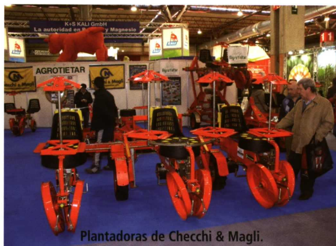
Plantadoras de Checchi & Magli.