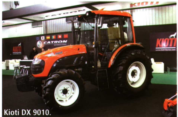
Kioti DX 9010.