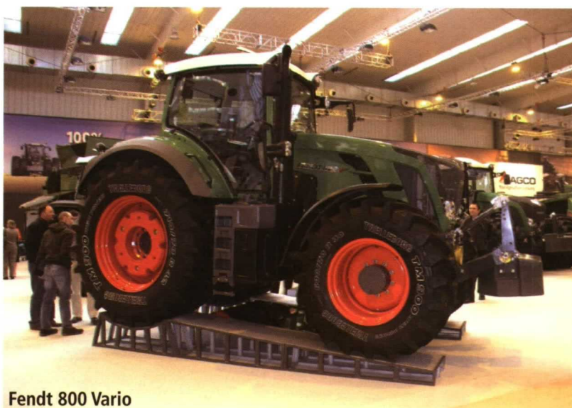
Fendt 800 Vario

Valtra mostró la Serie S, formada por tractores con potencias entre 250 y 370 CV con motores AGCO Sisu Power con common rail y sistema SRC (opcional) con