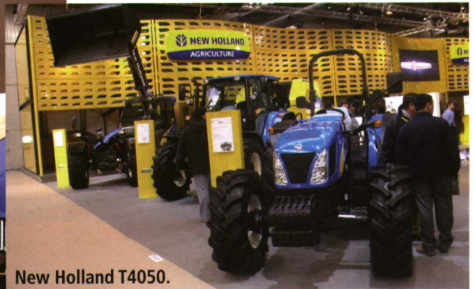
New Holland T4050.

También expuso el modelo superior de la serie T6000, el T6090 Grande de 174 CV de potencia, diseñado tanto para trabajos ligeros, como exigentes. Con la gestión automática de potencia tiene hasta 25 CV más. Posee un motor New Holland NEF de inyección common Rail de 6 cilindros y 6.8 L, transmisión full powershift PowerCommand™ (19x6 ECO) y nuevo reposabrazos Side-winder ™ II.