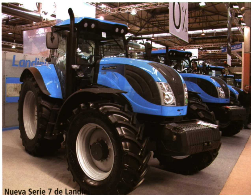
Nueva Serie 7 de Landini.

mina el pilar derecho central para aumentar la visibilidad. Este tractor también es apropiado para trabajos forestales.