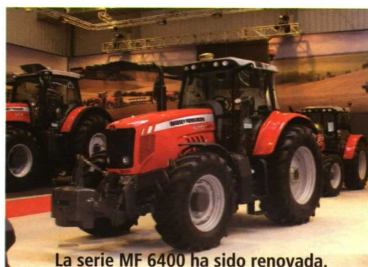
La serie MF 6400 ha sido renovada.