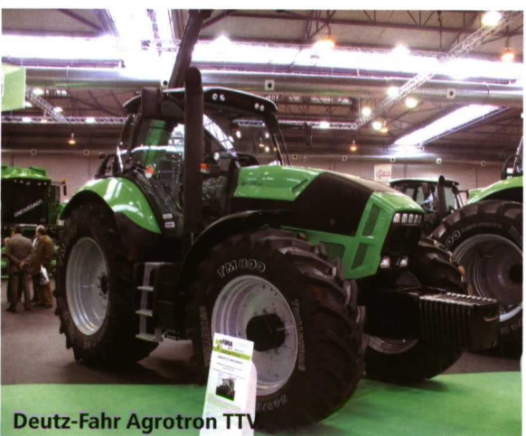
Deutz-Fahr Agrotion TTV

De la firma Same , destacaron los nuevos Silver 3 100 y 110 continuo, con transmisión infinitamente variable; Same Explorer 3 , con inversor hidráulico regulable; Same Dorado 3 versión Classic, con nuevos motores turbodiésel de 3 y 4 cilindros; y los dos modelos de la nueva gama Same Argon 3 , de 62 y 72 CV de potencia respectivamente, y sistema de inyección de alta presión.