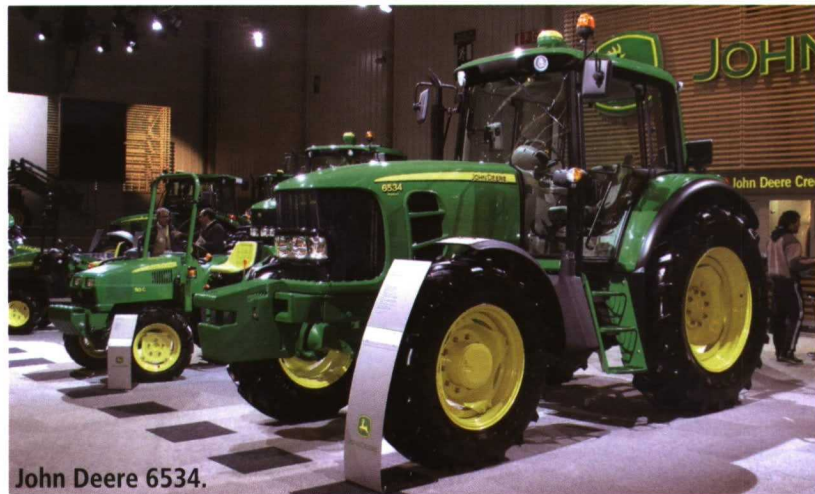
John Deere 6534.

También ha rediseñado y redefinido sus gamas Maxxum y Maxxum Multicontroller y presenta un nuevo modelo de tractor para ganaderos que realizan tareas exigentes a la toma de fuerza y numerosos transportes por carretera. Se trata del JXU 115, disponible con cabina de cuatro montantes, transmisión de 12x12 ó 24x24 marchas con dos velocidades powershift y powershuttle , o 20x20 con transmisión powershuttle y súper-reductor.