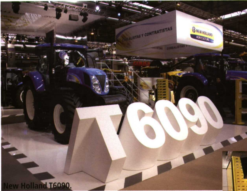
New Holland T6090.

También expuso el modelo superior de la serie T6000, el T6090 Grande de 174 CV de potencia, diseñado tanto para trabajos ligeros, como exigentes. Con la gestión automática de potencia tiene hasta 25 CV más. Posee un motor New Holland NEF de inyección common Rail de 6 cilindros y 6.8 L, transmisión full powershift PowerCommand™ (19x6 ECO) y nuevo reposabrazos Side-winder ™ II.