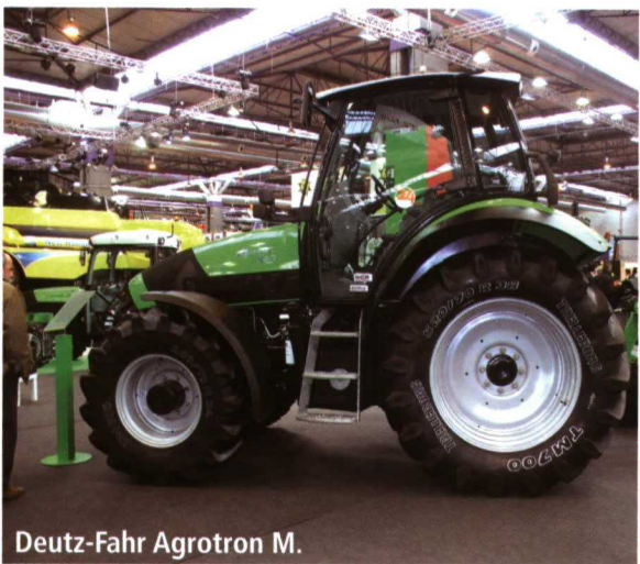
Deutz-Fahr Agrotion M.