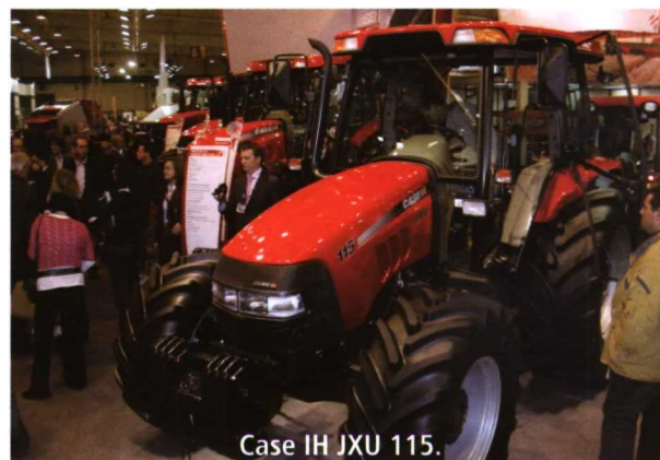
Case IH JXU 115.