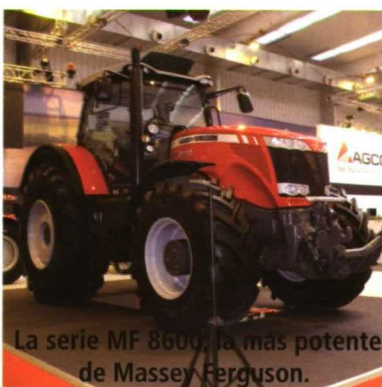
La serie MF 8600, la más potente de Massey Ferguson.