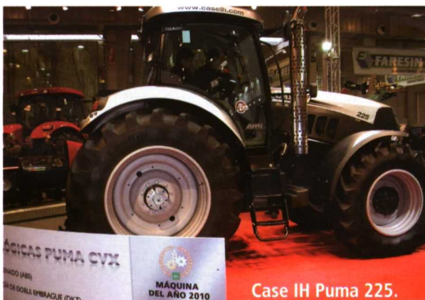
Case IH Puma 225.

canza desde los 100 a los 121 CV de potencia nominal, con un incremento de 10 CV boost al trabajar con la toma de fuerza. El Elios es un nuevo tractor semi-es-