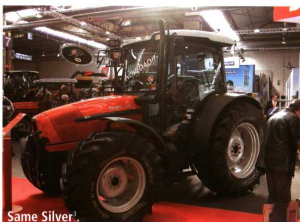
Same Silver 3 .