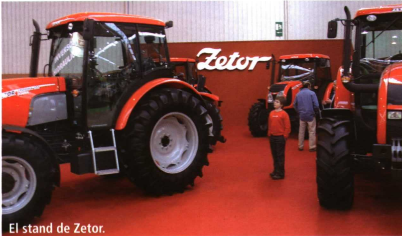
El stand de Zetor.