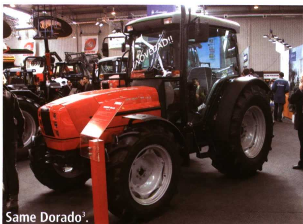
Same Dorado 3 .