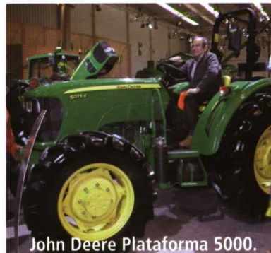
John Deere Plataforma 5000.