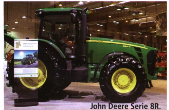
John Deere Serie 8R.

La gama de tractores Claas incluye dos incorporaciones: el Arion 400 y el Elios. El primero es un nuevo tractor estándar, con cuatro marchas bajo par, que al-