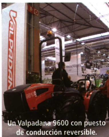
Un Valpadana 9600 con puesto de conducción reversible.

Las novedades en tractores del Grupo AgriARGO se centran, principalmente, en las gamas de potencias medias. Landini tiene un nuevo criterio de denominación para sus tractores (tres siglas que indican la familia, la potencia ISO y el subgrupo al que pertenece en función del nivel de equipamiento). Además expuso la Serie 7, formada por 6 modelos de 141 a 225 CV, que sustituyen a las series Powermaster y Powermax; y la Serie 5, que completa la oferta de la marca en la gama media.