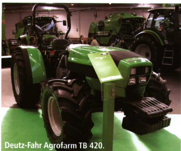
Deutz-Fahr Agrofarm TB 420.