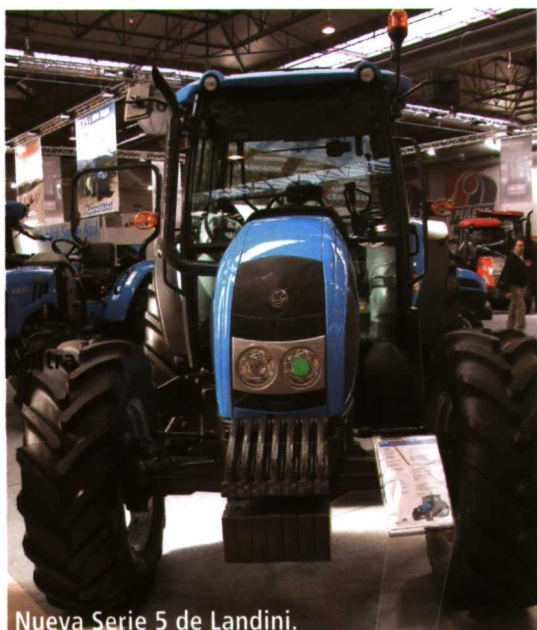
Nueva Serie 5 de Landini.