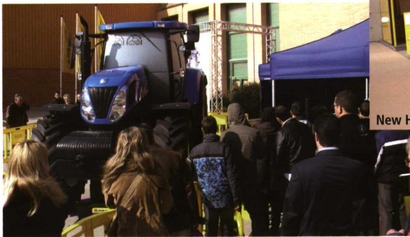
New Holland tuvo un espacio en el exterior para demostrar las posibilidades que ofrece el T7000 AutoCommand™.

Otro de sus tractores estrella fue el TD4000F, que mantiene el legado de la serie 86 de Fiat. Impulsados por modernos motores F5C de 4 cilindros y bajo consumo, combinan un diseño probado, con lo último en excelencia tecnológica. Los tractores T4000 Deluxe/Supersteer incorporan el eje SuperSteer ™ que permite ángulos de giro de las ruedas hasta 76°.