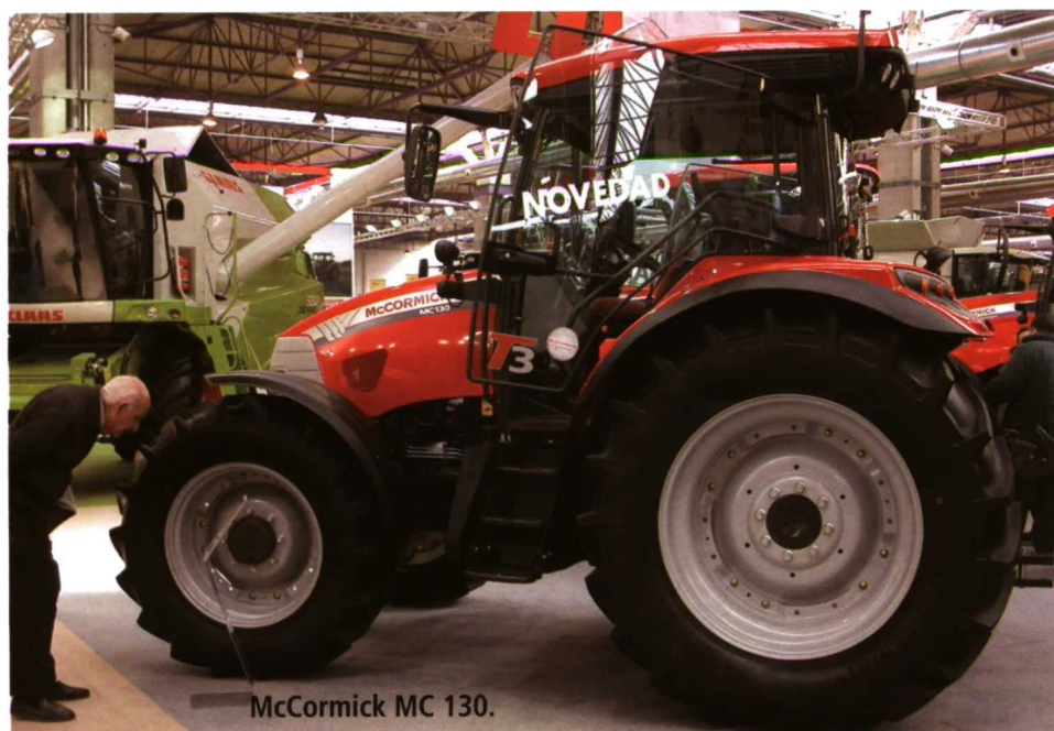
McCormick MC 130.

Por su parte, Valpadana completa su oferta en el rango de potencia entre los 70 y los 100 CV con la serie 9600, disponible en versiones articulada o rígida, monodireccional o reversible. La serie 6000 también ha sido renova-