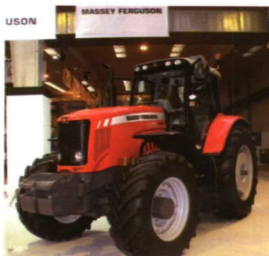
Dos modelos más en la MF 7400.

inyección de urea; y los tractores N HiTech (desde N82 hasta el N141) con nueva cabina de alta visibilidad SVC, en la que se eli-