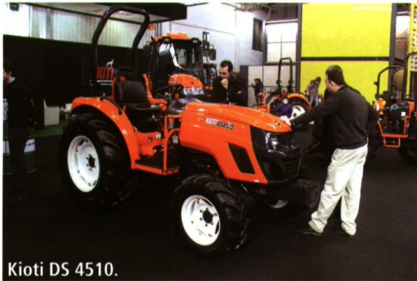
Kioti DS 4510.