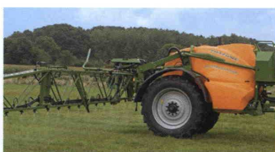
■ Pulverizadores arrastrados UX 3200 Special y 4200 Special, (280 L/min), capacidad de 3600 o 4500 L y anchura de 15 y 28 m.