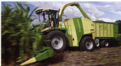
■ Sistema VariStream para cosechadoras de forraje Big X