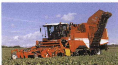
■ Cosechadora autopropulsada de remolacha Maxtron 620