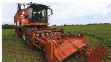
■ Cosechadora autopropulsada de remolacha Rexor 620 (6 filas)