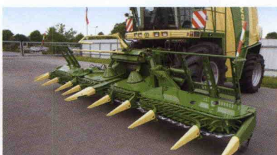
■ Cabezal para maíz EasyCollect 753