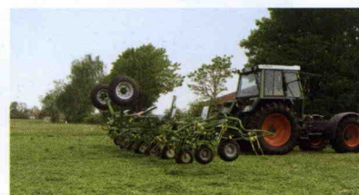
■ Rastrillo henificador KWT 11.22/10