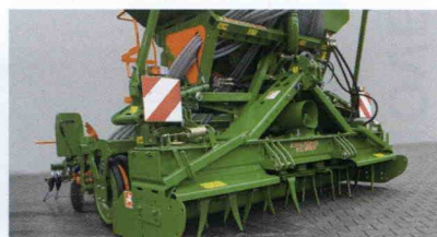
■ Cultivadores KX, para tractores de 190 CV