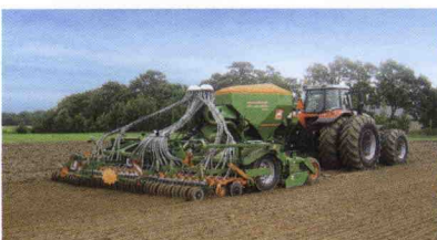
■ Cirrus Activ: Equipo combinado sembradora con cultivador integrado