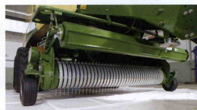
■ Sistema MaxDow para empacadoras gigantes