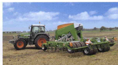
■ Sembradora de rejas Cayena para siembra rápida de 6 m de anchura