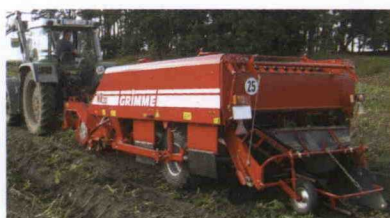
■ Arrancador-hilerador Windrower WR 200