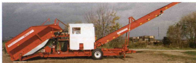
■ FL 720: Primera unidad de carga de campo con permiso de circulación vial