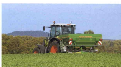
■ Abonadora ZA-M Ultra, hasta 52 m de anchura