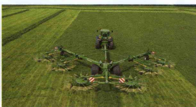
■ Rastrillo hilerador Swadro 2000