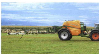
■ Pulverizadores arrastrados UX 6200 Super, con tolva de hasta 6 600 L y anchura de 18 a 40 m