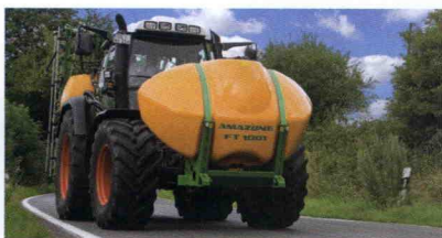
■ Abonadora UF combinada con tolva frontal FT