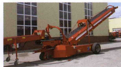
■ Telescópica con sistema Quantum