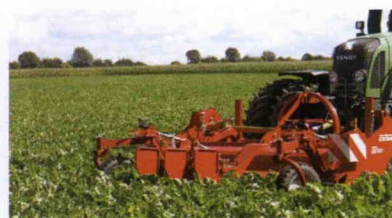
■ Sistema de guiado automático Root Runner