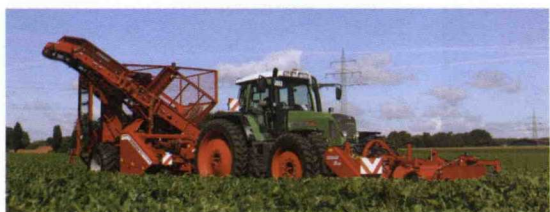
■ Arrancador de remolacha de 9 filas.