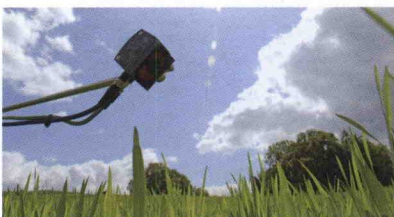
■ BreedVision: Tecnología para acelerar el desarrollo foliar de las plantas