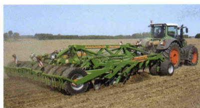
■ Centaur, cultivador de discos y púas con anchuras de 6 y 7 m