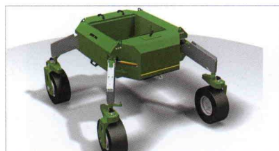
■ Robot BoniRob para aplicación de fertilizantes y control de las malas hierbas