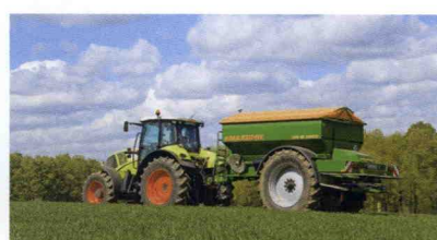
■ Abonadora arrastrada ZG-B, hasta 52 m de anchura