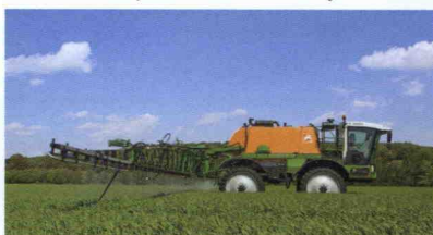
■ Abonadora autopropulsada SX 4000 con sistema de guiado automático Trimble