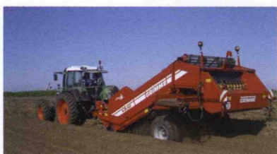
■ Sistema Maxi Beet para mayor rendimiento en el cultivo de patatas y hortalizas en bancales