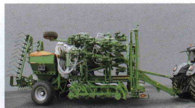
■ Equipo combinado Primera DMC 12000, hasta 12 m de anchura