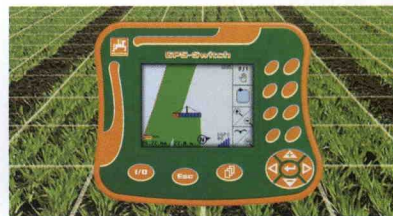
■ GPS-Switch: Controlador de la anchura de trabajo para equipos de tratamientos