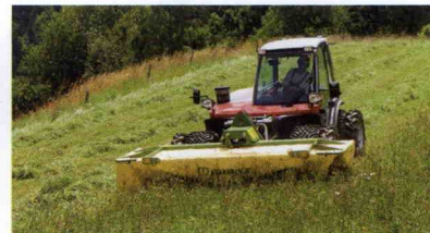
■ Segadora frontal para laderas EasyCut 32 M