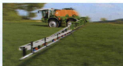
■ Sistema Speed Spraying, tratamientos hasta 150 L/ha y a 12 km/h