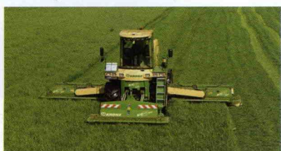
■ Segadora autopropulsada Big M 400