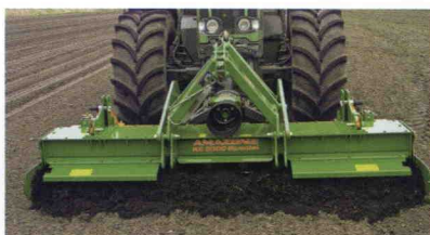
■ Chasis para gradas rotativas frontales serie KE