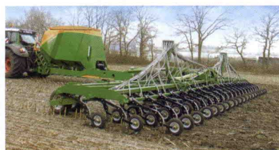
■ Sembradora de rejas Condor, hasta 15 m de anchura