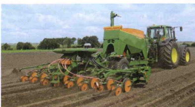
■ Sistema Xpress para sembradoras monogranos EDX 6000-T