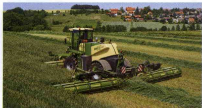
■ Segadora autopropulsada Big M 500 (20 ha/h)