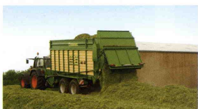
■ Ampliación de la gama de cargadores de forraje MX.