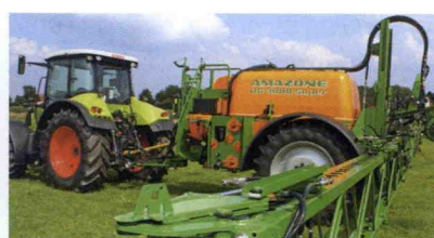
■ Pulverizadores arrastrados UG Special y Super