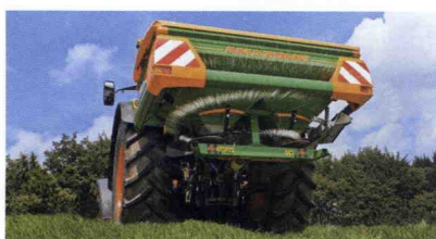
■ Abonadora ZA-M con sistema de seguridad