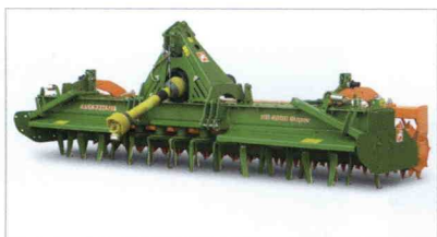
■ Gradas rotativas KE Special y KE Super