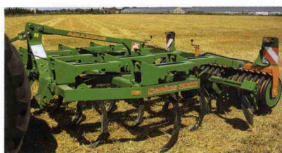
■ Cultivadores Cenius, de 3 a 4 m de anchura para tractores pequeños y medianos

Cerró la presentación Grimme, una empresa con más de 150 años de historia, que con un cifra de negocios de 200 millones de euros,