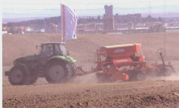
Deutz-Fahr Agrotron TTV 630 con sembradora Pöttinger Terrasem.

Entre las diferentes y variadas actividades organizada durante toda la jornada se encontraba un concurso de habilidad, en el que los participantes debían ir apilando hasta un total de seis pacas evitando su caída para así recibir su correspondiente premio.