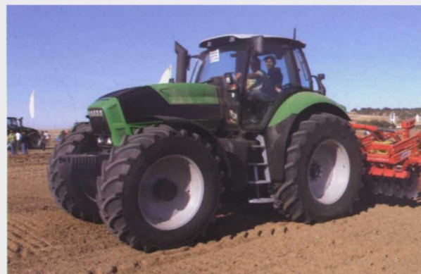
Deutz-Fahr Agrotron X 720 con grada de discos escotados Pöttinger Terradisc 4000.