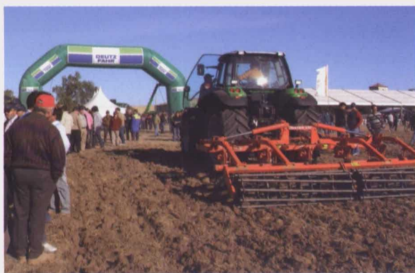
Deutz-Fahr Agrotron L 720 con apero Kuhn Mixer 100.

En resumen, una verdadera 'Fiesta del Campo' que sirvió para poner al alcance de los potenciales clientes las innovaciones que Same Deutz-Fahr acaba de poner en el mercado europeo, con una organización perfecta que dejó a todos satisfechos.