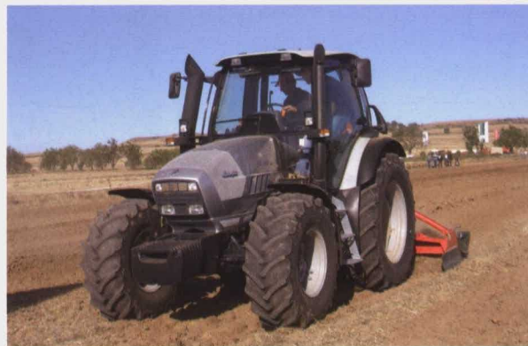
Lamborghini R6 140 DCR con grada rotativa Vogel & Noot MS 300.