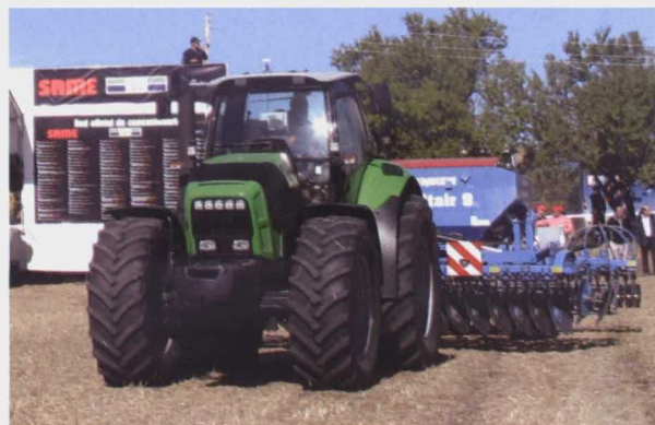
Deutz-Fahr Agrotron X 720 con grada Rubin+sembradora Lemken, equipado con GPS.