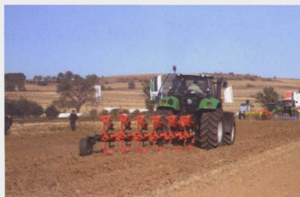
Deutz-Fahr Agrotron X 710 con arado de 6 cuerpos Vogel & Noot.