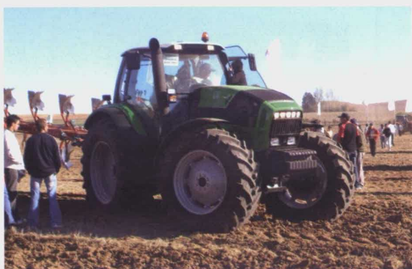
Deutz-Fahr Agrotron L 720 con arado de 6 cuerpos Gregoire & Besson.