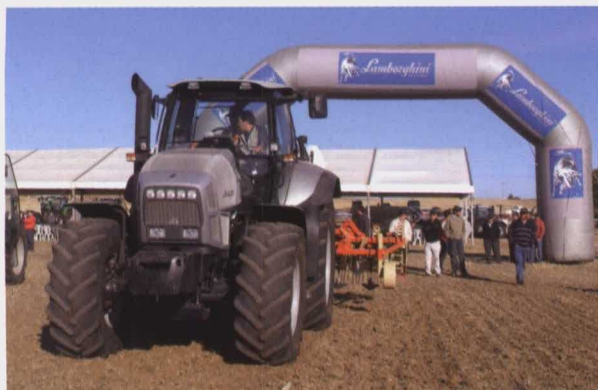
Lamborghini R8 230 DCR con cultivador Torpedo.