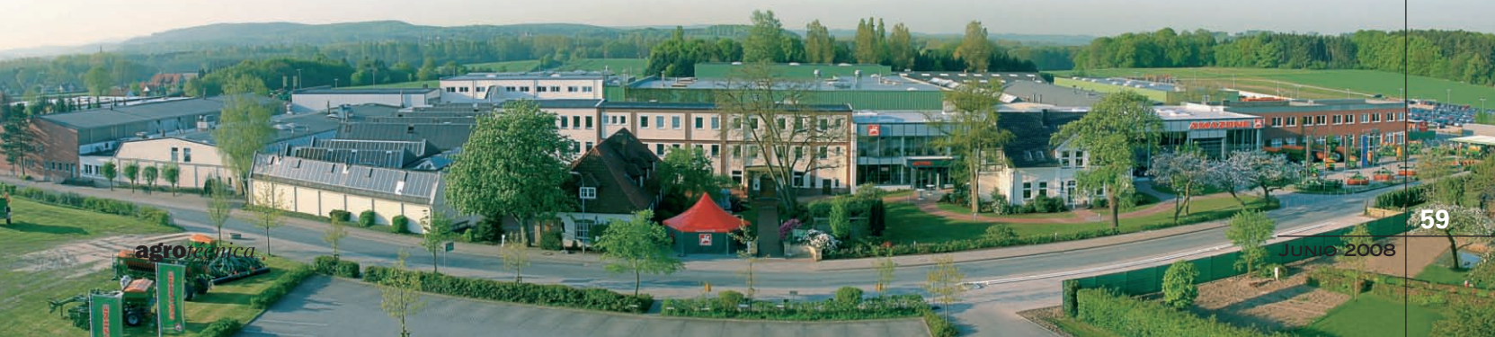
Imagen panorámica de las instalaciones centrales del Grupo Amazone en Gaste (Alemania).