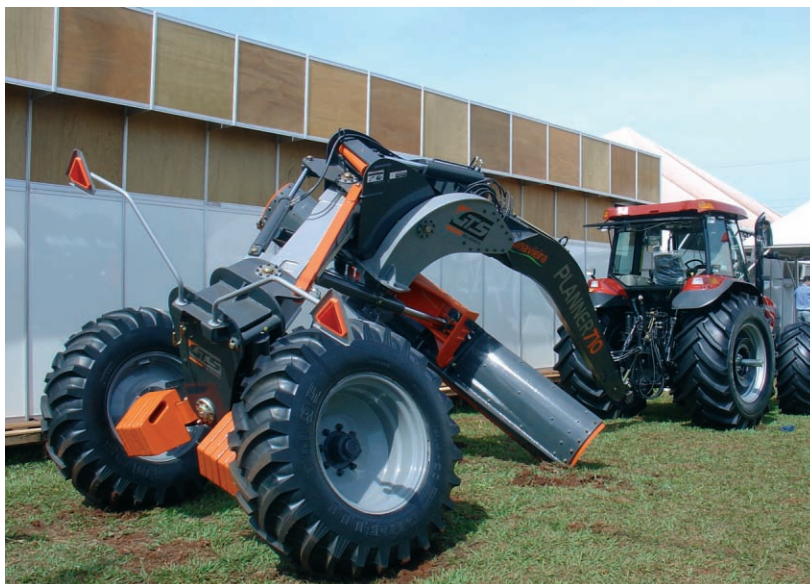
Niveladoras para preparación de campos de caña.

El Gobierno de Sao Paulo, anunció la financiación de 6 000 tractores, con plazo de amortización a 5 años sin intereses, con potencias de 50/70 y 90 CV, que animaron a las marcas del país. Brasil practica una política de aranceles fuertemente proteccionista para los fabricantes locales, lo que hace que quien quiera vender pase por instalarse mediante acuerdos o implantación propia, algo similar sucede con los fabricantes de maquinas y aperos; El estar presente en la 'locomotora de MERCOSUR, tiene también sus ventajas.