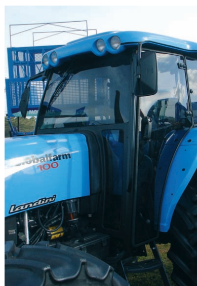
La gama de Landini se adecúa a las necesidades del mercado. Este cerramiento desarrollado por Brascab está integrado perfectamente en la línea del tractor.

LAS EXPECTATIVAS DE LA ZAFRA DE ESTE AÑO SE APROXIMAN A LOS 600 MILLONES DE TONELADAS DE LAS CUALES 322 MILLONES SE DESTINARÁN A BIOCOMBUSTIBLES