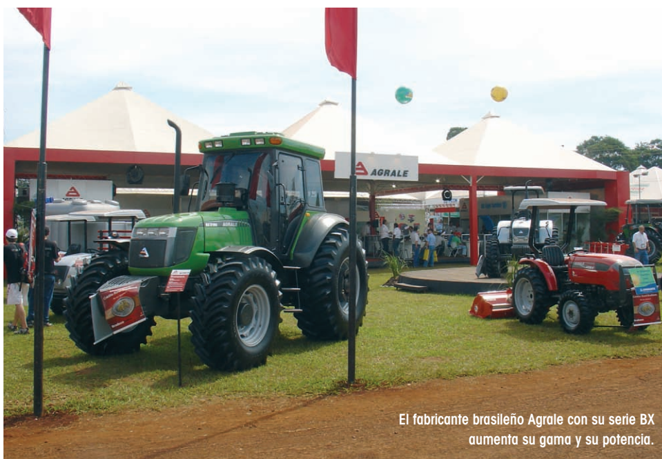
El fabricante brasileño Agrale con su serie BX aumenta su gama y su potencia.

LAS EXPECTATIVAS DE LA ZAFRA DE ESTE AÑO SE APROXIMAN A LOS 600 MILLONES DE TONELADAS DE LAS CUALES 322 MILLONES SE DESTINARÁN A BIOCOMBUSTIBLES