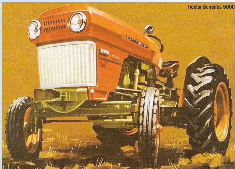
Tractor Barreiros 5000.

íntegramente en el Departamento de Diseño e Investigación de productos de la empresa, y que ha marcado la pauta para la introducción de la gama que ahora se completa. En su concepción, los diseñadores han considerado las necesidades de trabajo del agricultor medio español, y su configuración no está relacionada con la línea Hanomag seguida en los restantes modelos. Como es costumbre en la empresa, todos los tractores continúan incorporando los afamados motores Barreiros.