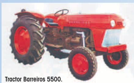
Tractor Barreiros 5500.

A lo largo de los años '60, el mercado de tractores en España crece de manera continua, alcanzando en 1968 una cifra de 24 919 unidades, de las que un 20.4% son de la marca Barreiros. Ese año, la compañía presenta el modelo 4000, que sustituye al tractor R-335 S. Esta unidad incorpora el diseño externo del modelo 5500, introducido dos años antes, y marca el camino para la renovación de la serie, que se consumará en 1969 con las incorporaciones del modelo 5000 –que reemplaza al tractor R-500– y del modelo 7000 que sucede al tractor 5500. El modelo 7000 marca un hito en la historia de Barreiros puesto que se trata de un tractor de corte moderno que incluye novedades como reductoras epicicloidales en el eje trasero, una nueva caja de cambios más ágil, toma de fuerza proporcional al avance, frenos de disco herméticos y una menor relación peso/potencia. Este tractor es una evolución mejorada del modelo 5500, cuyo desarrollo se ha realizado