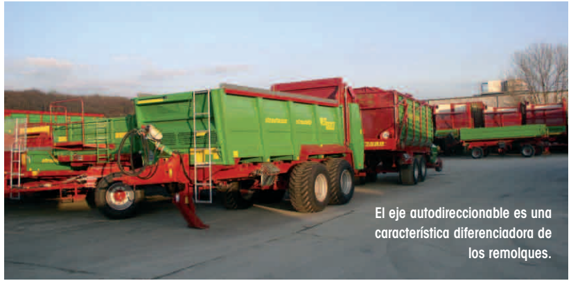
El eje autodireccional es una característica diferenciadora de los remolques.