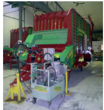
Una vez montada, cada unidad se comprueba durante dos horas en el Departamento de Control de Calidad.

Una de las claves del éxito de Strautmann radica, precisamente, en la eficacia de su Departamento de Recambios, ca-