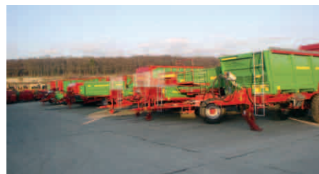
La gama de producto de Strautmann abarca remolques autocargadores picadores de forraje, remolques esparcidores de estiércol y distribuidores universales para subproductos orgánicos.

Y es que este fabricante alemán, como destacan sus directivos, es un auténtico especialista en dos tipos de producto, que son en los que divide su gama actual: tecnología para alimentación animal (carros mezcladores, que suponen el 37% de las ventas) y tecnología para el transporte especializado (remolques autocargadores, con el 30%).