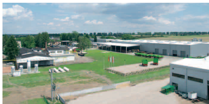
Los dos centros de producción de la empresa se encuentran en Bad Laer (Alemania) –izquierda– y Lwówek (Polonia).