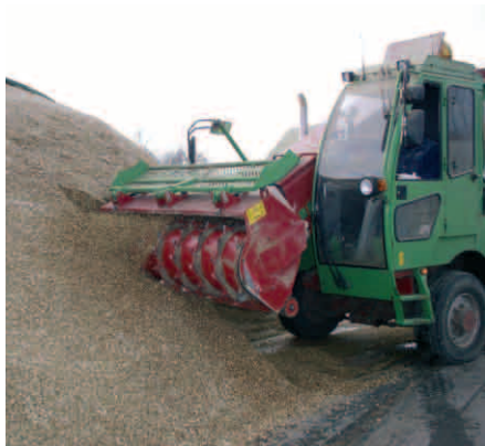
Una de las principales ventajas de los mezcladores Strautmann es que evita las pérdidas de calidad del alimento.

La cadena de montaje está dividida en dos líneas diferenciadas según el tipo de producto. Aquí trabajan el 80% de los 220 empleados que tiene la empresa en Bad Laer, divididos en equipos de unas siete personas distribuidos en lo que denominan 'islas de montaje'.