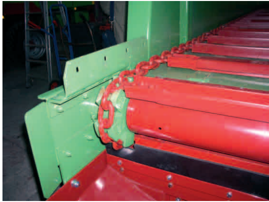
El espesor de las piezas utilizadas en el montaje de los remolques es de 6 mm