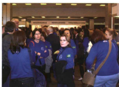
La delegación brasileña fue la más numerosa.

La 'extensión' de la naturaleza en las ciudades es uno de los instrumentos más eficaces para mejorar la calidad de vida. Pero han