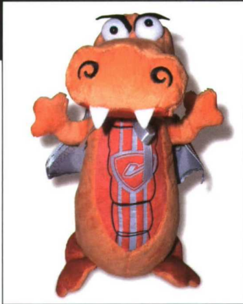
La mascota presentada es el cocodrilo Superpadano.

se han introducido matices, como el 'gris aluminio' y un tono diferente del rojo corporativo, "pasional, dinámico, tecnológico", según es definido desde la propia empresa. En el centro destaca la 'V' de Valpadana que pretende evidenciar la evolución tecnológica mostrada a lo largo de la historia de la marca manteniendo vivo el recuerdo original.