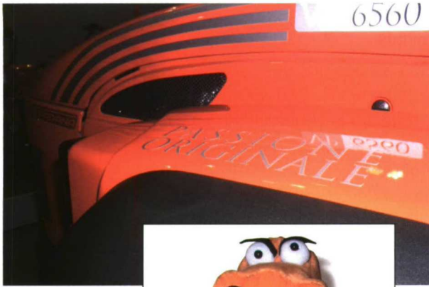
La nueva imagen queda reflejada en los productos.