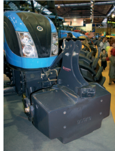
Un tractor Landini expuesto en la feria montó un contrapeso delantero de Zuidberg.