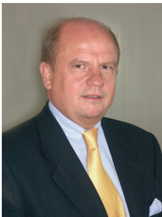
Martín Richenhagen, Presidente del Grupo AGCO.

El Grupo AGCO ha hecho público un comunicado en el que ofrece sus resultados económicos correspondientes al ejercicio 2005, donde destacan unas ventas netas de 5 449.7 millones $ y una renta neta de 31.6 millones $, es decir, 0.36 $ por acción.