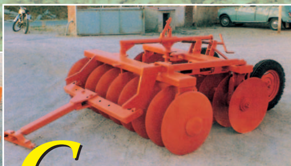
G RADA SEMISUSPENDIDA