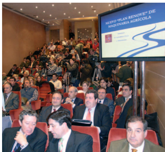
A la presentación acudieron, entre otros, representantes de las marcas y de la Feria de Zaragoza.

La ministra destacó que, tras la experiencia con el anterior Plan Renove, al que sólo se acogieron 263 tractores en 2005 y 285 en 2006, se han simplificado los trámites burocráticos para lograr que las ayudas resulten más accesibles. Al incremento en la partida presupuestaria se une la rebaja de la antigüedad mínima