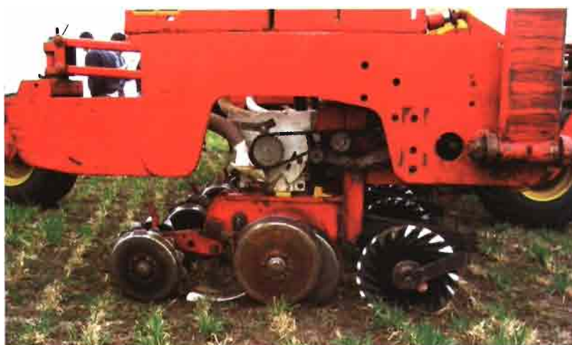
Cuerpo de siembra con cuchilla turbo.

Para que la siembra directa funcione hay que manejar de