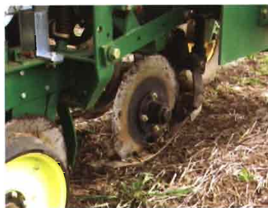
Cuchilla lisa con patines de apoyo.

Por otra parte, la consistencia de los suelos, el contenido de humedad y la abundancia de residuos son factores que condicionan cualquier intervención.