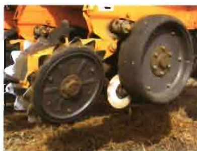
Rueda asentadora y doble rueda tapadora.

nes agrícolas, tiene su reflejo en las sembradoras de siembra directa, que en una sola pasada lo tiene que hacer todo, y sin que haya posibilidades de una segunda oportunidad. De aquí las variantes que suministra el mercado, las opciones que cada fabricante ofrece y la dificultad para diseñar una máquina compacta,