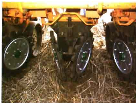
Barredores de rastrero por delante del cuerpo de siembra.