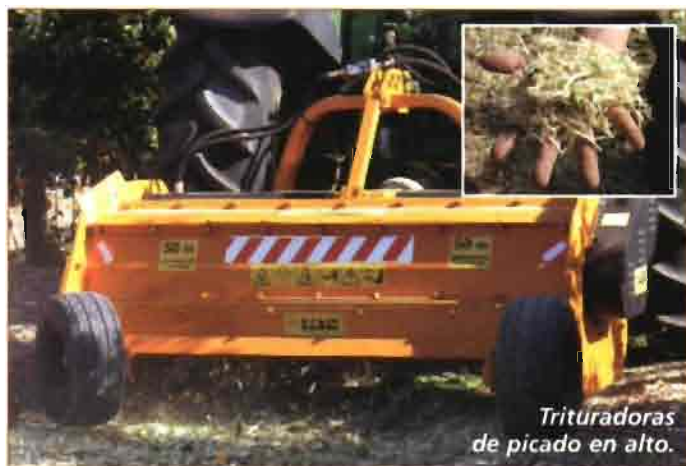
Trituradoras de picado en alto.