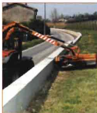
Desbrozadoras de brazo.