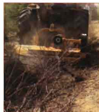
Trituradoras polivalentes con versiones reversibles.

7 gamas específicas que se adaptan a cualquier tipo de trabajo de trituración: