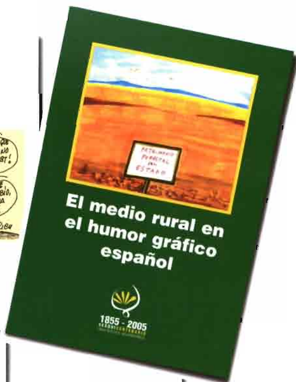
El ministro de Justicia, Juan Fernando López Aguilar, es un reconocido seguidor del dibujo humorístico.