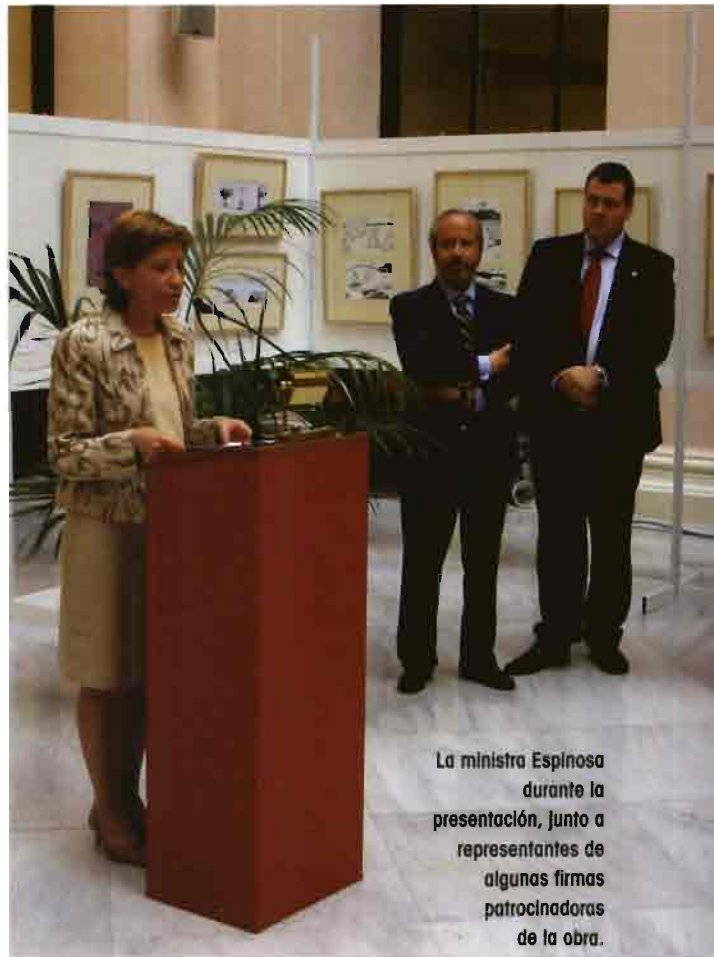
La ministra Espinosa durante la presentación, junto a representantes de algunas firmas patrocinadoras de la obra.

Para dar a conocer dicha exposición y la presentación del libro-catálogo, la Asociación de Ingenieros Agrónomos llevó a cabo una cita a la que acudieron la ministra de Agricultura, Pesca y Alimentación, Elena Espinosa, el secretario general