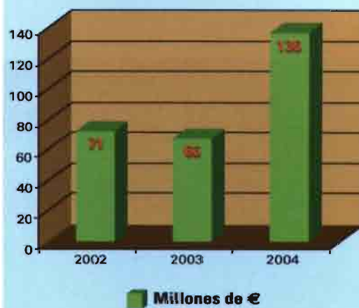
FACTURACIÓN DE LAVERDA