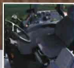
Cabina Suspendida para un gran confort