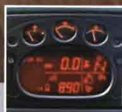
Nueva Instrumentación (MTX165 - 185)