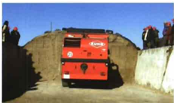
Primor / Primor 3560:

Mezcladora concebida para la realización de raciones fibrosas, especialmente adaptada para la alimentación de animales de engorde (bovinos), así como ovinos y caprinos.