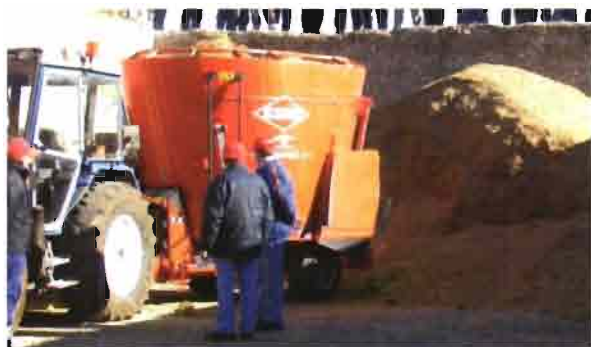
Euromix II 1460:

Mezcladora concebida para la realización de raciones fibrosas, especialmente adaptada para la alimentación de animales de engorde (bovinos), así como ovinos y caprinos.