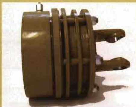
WALTERSCHEID: Limitador de par, variable y desembragable