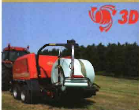
KVERNELAND GROUP (VICON): Envolvedora en 3 dimensiones para pacas cilíndricas