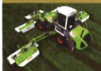
CLAAS: Segadora autopropulsada