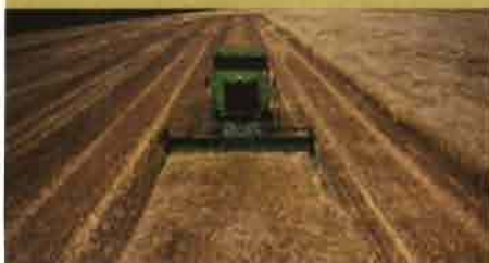
JOHN DEERE: Gestión automatizada del guiado y de la velocidad de avance en máquinas de recolección