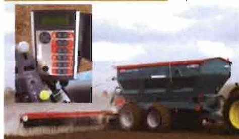
SULKY BUREL: Consola electro-hidráulica para esparcidores de abono arrastrados