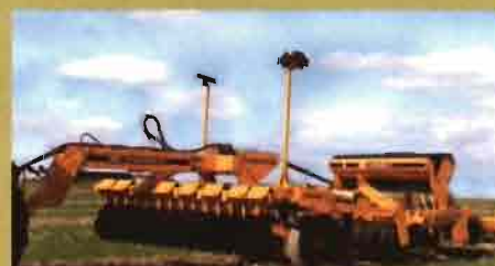
AGRISEM: Arado para técnicas de conservación de suelos con siembra integrada