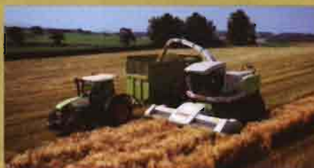
CLAAS: Segadora de discos de corte directo para picadoras cargadoras autopropulsadas