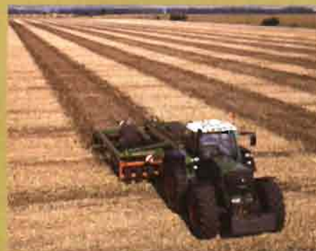
AGCO (DIVISIÓN FENDT): Auto Guía: Sistema de guía automática asistida por GPS