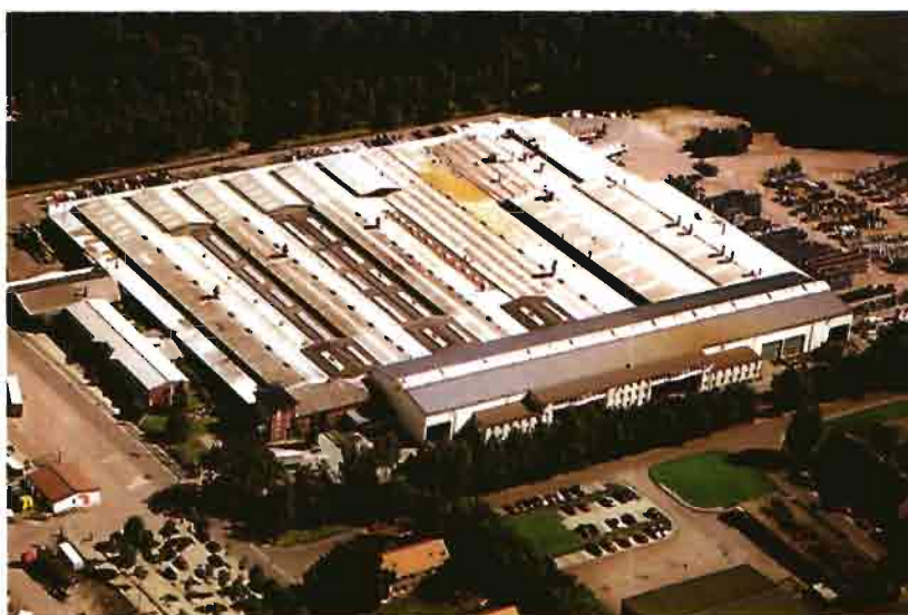
Las instalaciones centrales de Krone reflejan la gran evolución mostrada por la compañía.

Diez años después, superada la convulsión originada por el conflicto bélico, llega la construcción del primer edificio de la fábrica de maquinaria agrícola. Comienza la fabricación en serie de una gama de productos cada vez más amplia. Así, en 1948 llega el primer arado de vertedera en el mundo con enganche a tres puntos, del que se produjeron más de 150 000 unidades. También fueron apareciendo otro tipo de