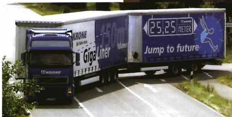
Los remolques frigoríficos suponen otra división del negocio de Krone.