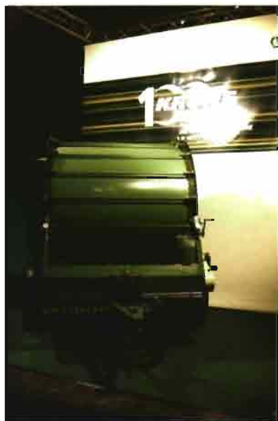
La primera rotoempacadora desarrollada por Krone supuso una revolución en el mercado en los años '70.

máquinas, como fresas, rotravators, etc.