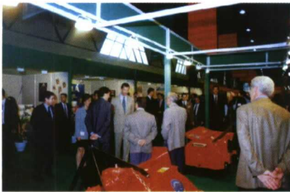
El príncipe Felipe visitó el stand de Agrator, donde se interesó por la maquinaria expuesta.

Agragex estuvo presente en la décima edición de Expotecnia, celebrada en Estambul entre el 1 y el 6 de junio. Con una representación de 18 empresas que ocupaban una superficie de 350 m 2 , y bajo el lema 'Descubra la España que no conoce', la Asociación Española de Fabricantes Exportadores de Maquinaria Agrícola y sus Componentes, Sistemas de Riego y Equipos Ganaderos obtuvo resultados muy provechosos.