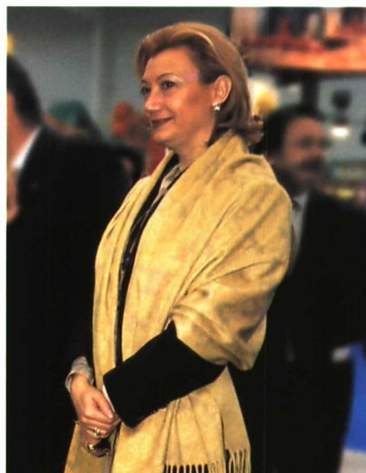
Luisa Fernanda Rudí, regidora de Zaragoza.