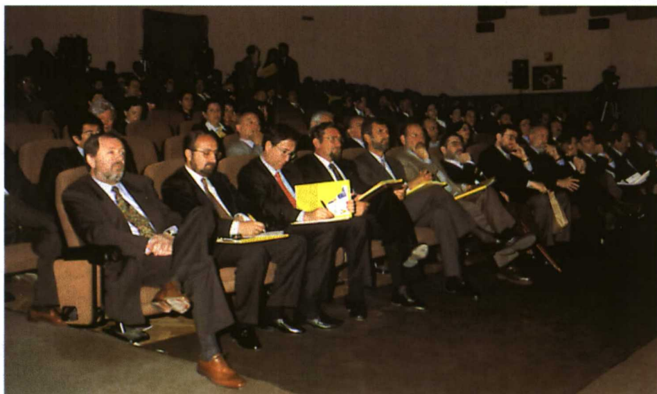
Distintos directivos del grupo FIAT presentaron su apoyo al proyecto.

de Paraplégicos de Toledo un simulador de conducción que permita facilitar los trámites de evaluación objetiva necesarios para la obtención del carnet de conducción especiales en España.