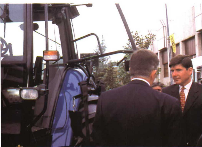
El ministro de Trabajo, Manuel Pimentel, se quedó asombrado de las modificaciones realizadas en los tractores.

tas áreas como transportes públicos, transportes individuales, maquinaria agrícola y en general de todas las empresas que forman el grupo, que tendrán una parte importante de su capítulo de I+D para que la facilidad del transporte y empleo esté al alcance de todos, en este punto es en el que se basó el consejero delegado del grupo Fiat, Paolo Cantarella, quien durante su alocución reconoció lo complejo y largo que es el camino que aún queda por recorrer ya que según él hay que crear algo más que infraestructuras y leyes, también hay que cambiar la mentalidad y la cultura colectivamente.