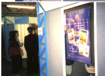
Expositores y público en general de distintos países visitaron el stand de agrotécnica en EIMA '99.