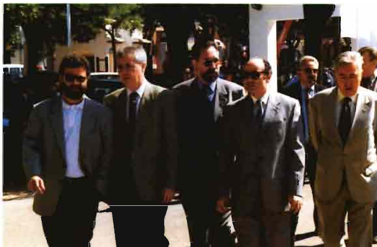
Los responsables políticos visitaron los stands, uno por uno, durante la jornada inaugural.

"FERCAM es una innovación permanente" , según el delegado de la Junta, y provoca "el desarrollo de la región" .