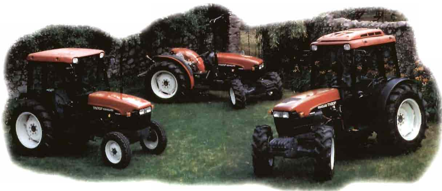
Los TNF de New Holland, incluidos en la gama de 'fruteros anchos', aportan nuevos parámetros de referencia en electrónica aplicada.