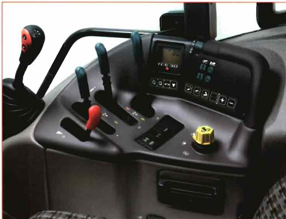
En la completa cabina del Renault Ares destacan los mandos del TCE.

Tractores estrechos New Holland TN 65F, TN 75F y TN 90F , con sistema de dirección que permite un giro de 76° en las ruedas del eje delantero, así como con la conexión automática de la tracción delantera.