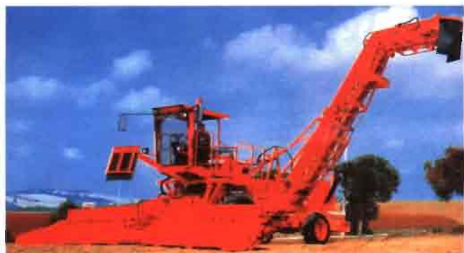
El equipo imprescindible para la cosechadora Barigelli B/6 es el cargador-limpiador autopropulsado, que le permitirá un sustancial beneficio por hectárea