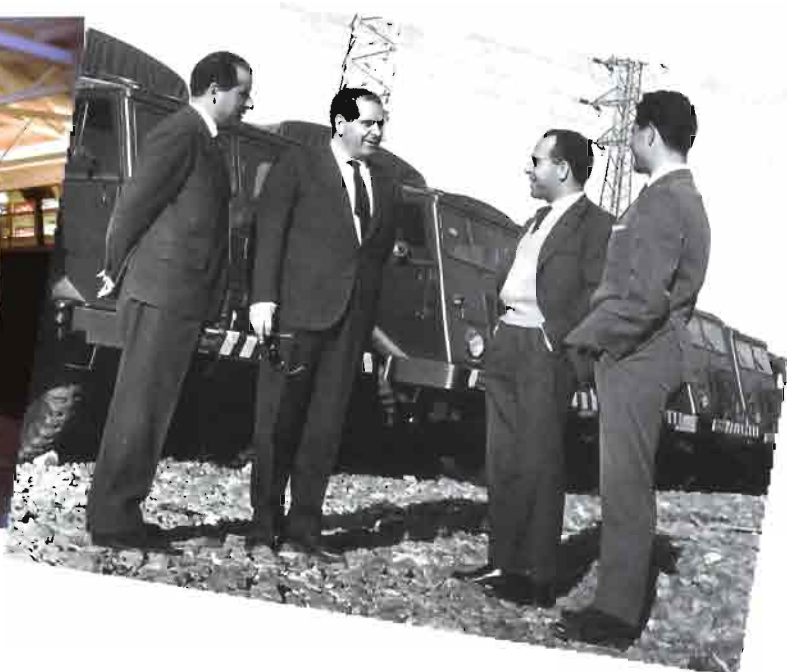
El nombre Barreiros ha sido siempre sinónimo de calidad y prestigio en el mundo de la tecnología de la automoción.