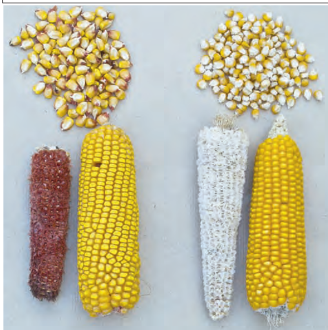
FIGURA 2 / Las dos poblaciones sintéticas: la población dentada EZS34 (izquierda) y la población lisa EZS33 (derecha)

Se han evaluado los tres ciclos de selección recurrente recíproca interpoblacional en ambas poblaciones en 5 ambientes (2 años y 3 localidades). Los años fueron 2009 y 2010, y las localidades de los ensayos: Montañana y Zuera (Zaragoza) y Torres de Alcanadre (Huesca). Los genotipos evaluados fueron las 8 poblaciones per se (EZS33C0, C1, C2, C3 y EZS34C0, C1, C2, C3), los 28 cruzamientos interpoblacionales entre los ciclos de selección, y 4 híbridos comerciales como testigos de referencia en los ensayos. Se estudió la respuesta de los cruzamientos y de las poblaciones per se para el carácter rendimiento y las respuestas correlacionadas en otros caracteres agronómicos de interés (Peña Asín, 2012). La ganancia de rendimiento de grano en el cruce interpoblacional (EZS34x EZS33) se incrementó de manera lineal y significativa a lo largo de la me-