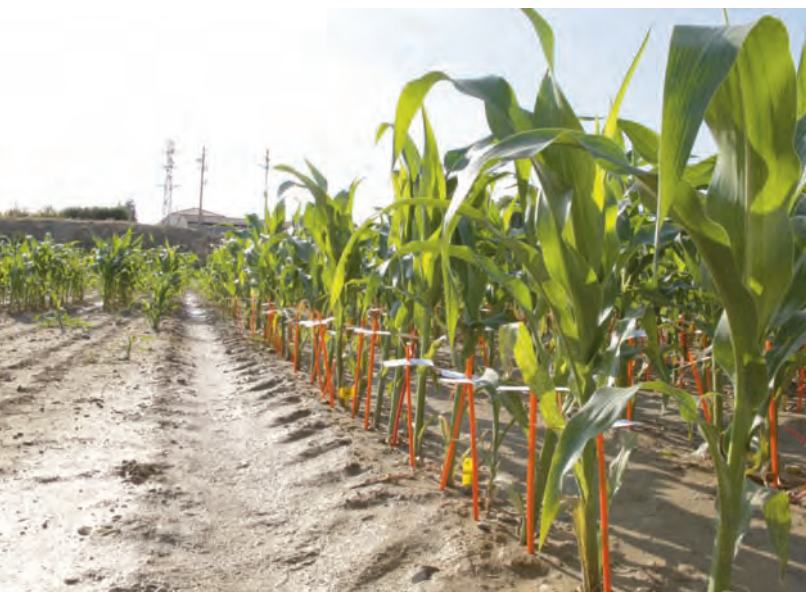
Identificación y descripción de plantas en campo