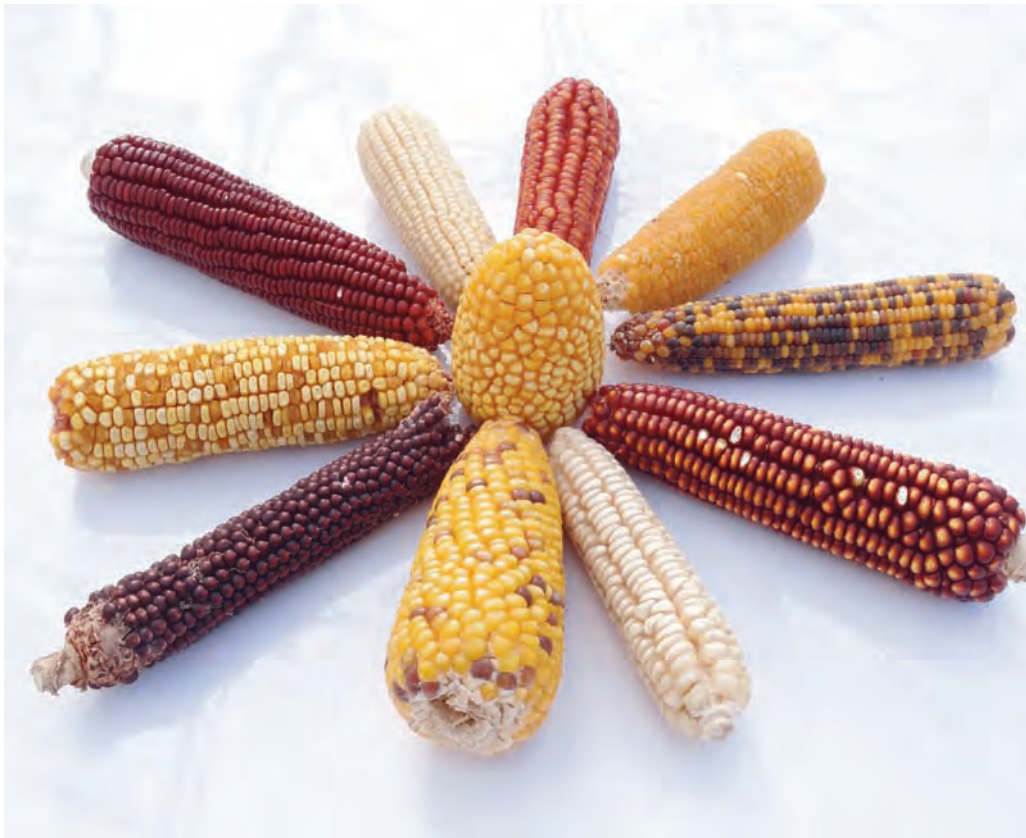
Ejemplo de variabilidad genética del maíz

A nivel mundial el maíz es el primer cereal en producción de grano, con 819 millones de toneladas y una superficie sembrada de 160 millones de hectáreas, aunque en superficie es el tercero más cultivado después del trigo y arroz (FAO, 2012). Actualmente el maíz constituye la base de numerosos alimentos tanto para humanos como para animales domésticos, y de otros productos industriales, como el etanol o los bioplásticos. La mejora genética y el adecuado manejo del cultivo, como los más eficientes sistemas de riego, aportes nutricionales, la oportuna elección de la densidad de siembra y la mejora de la maquinaria y los agroquímicos, han proporcionado excelentes rendimientos a los actuales híbridos de maíz, haciendo que su cultivo sea mayoritario.