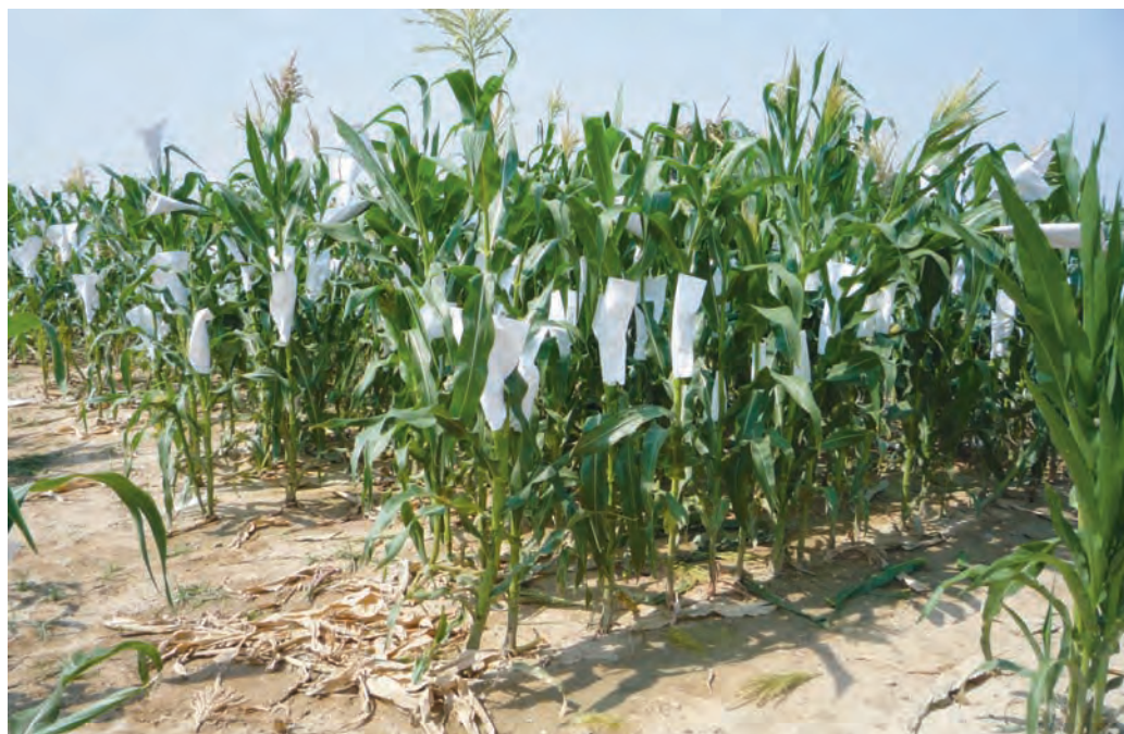
Ensayo de selección de plantas polinizadas. Montañana -2009-

jora en un 2.98% por ciclo, es decir 246.1 kg/(ha y ciclo), mientras que en las poblaciones EZS33 y EZS34 las diferencias no fueron significativas. En relación a otros caracteres agronómicos de interés, se han mostrado valores muy positivos y con un elevado margen de mejora si se continúa con estos objetivos en el programa de selección.