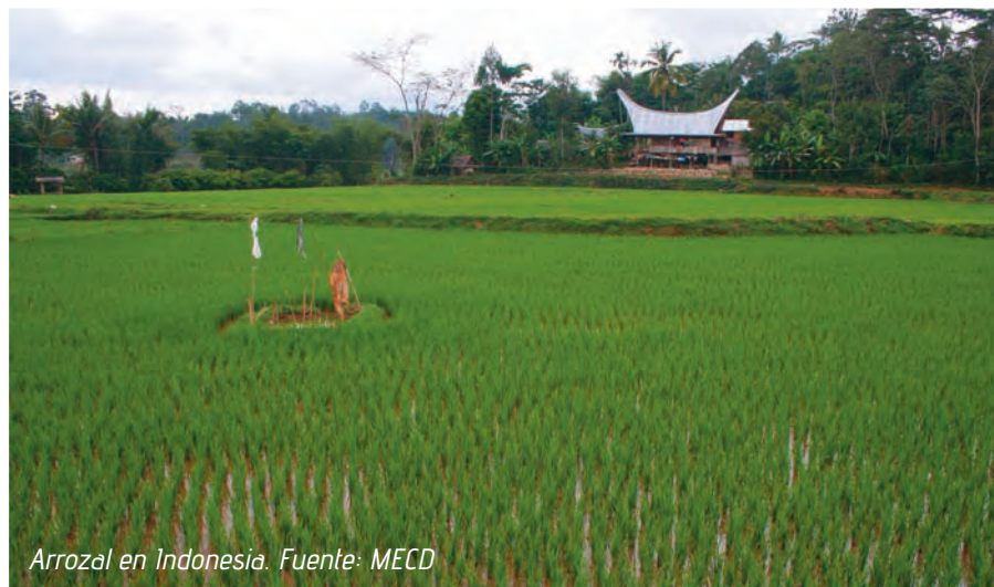
Arrozal en Indonesia.

Admito que esta es la primera vez que me enfrente a este particular producto de nuestra agricultura. Y la duda surge de forma automática. ¿No se suponía que estábamos en la parte alta del ciclo de precios de los cereales en todo el mundo? Pues