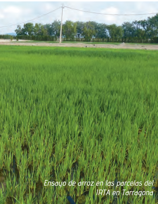
Ensayo de arroz en las parcelas del IRTA en Tarragona

portantísimo para ciertas zonas de nuestro país, “es un cultivo típico de zonas marginales, en donde no existen otras alternativas. En las zonas productoras de Andalucía, Valencia, Cataluña y Aragón no hay muchas alternativas al arroz debido al nivel de las capas freáticas. Y Aragón y Navarra por la salinidad del agua, que no las hace apta para otros cultivos”.