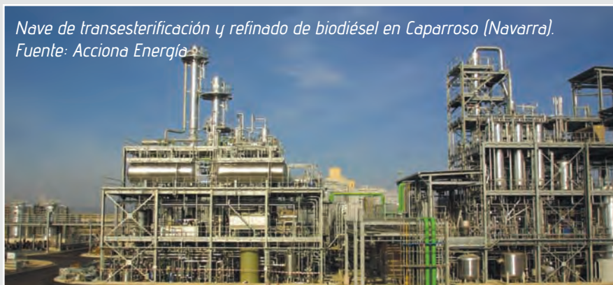
Nave de transesterificación y refinado de biodiésel en Caparrosa (Navarra).

El presidente de la Asociación de productores de Energías Renovables (AppA) Biocarburantes, venía años reclamando al Gobierno la adopción de medidas internas similares a las aplicadas en Francia, Bélgica, Portugal o Grecia. Ausín recuerda que el antiguo Ministerio de Industria (MiTyC) decidió a mediados de 2010 impulsar un proyecto de orden de asignación de cantidades de producción de biodiésel, que fue oficialmente presentado a finales de octubre de ese año. Esta orden ministerial estipula que para cumplir