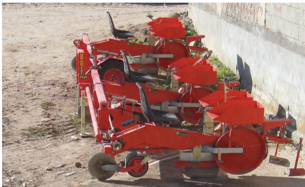
Plantadora de plantón y estaquilla de 3 cuerpos. Extremadura.

Numerosos proyectos de plantas de generación eléctrica con biomasa se estaban tramitando antes de la incomprensible moratoria de las renovables que el equipo de gobierno actual publicara, el RD 1/2012. Este hecho ha modificado las expectativas optimistas que el sector agrícola tenía depositadas en estos cultivos. La no continuidad de los proyectos deja paralizadas más de 5.000 ha ya plantadas, ahora sin destino ni uso. El futuro de los cultivos energéticos depende, ahora más que nunca, de la valorización energética para uso térmico en calderas, tanto domésticas como industriales.