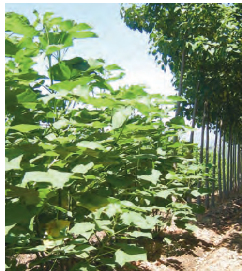
Campo de ensayo de Paulownia en Extremadura