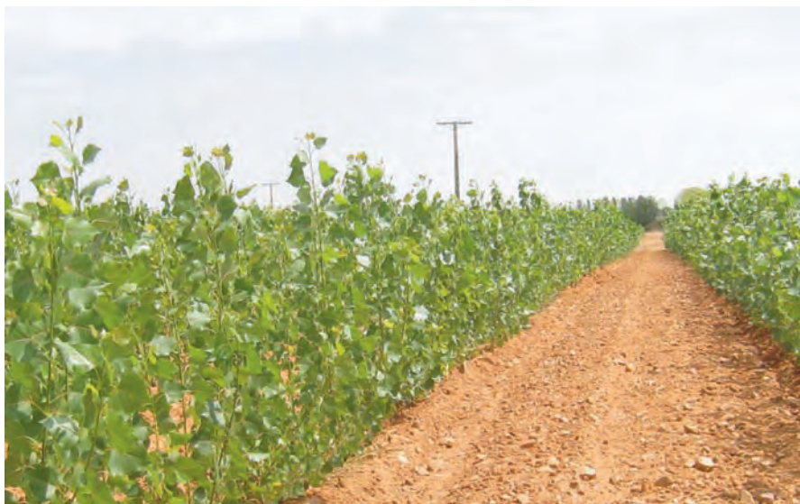
Chopo R1T1 de la empresa PRICONVAL en Faramontanos de Tábara (Zamora). Proyecto On-Cultivos.