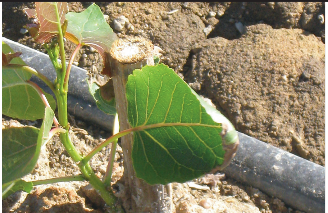
Estaquilla recién brotada. Plantación en época estival. Extremadura.

Sobre todo para ser utilizada en calderas de muy diversa tipología, ya sea en la generación eléctrica como en la generación térmica. Además, es un material que posee un bajo contenido en nitrógeno, azufre y