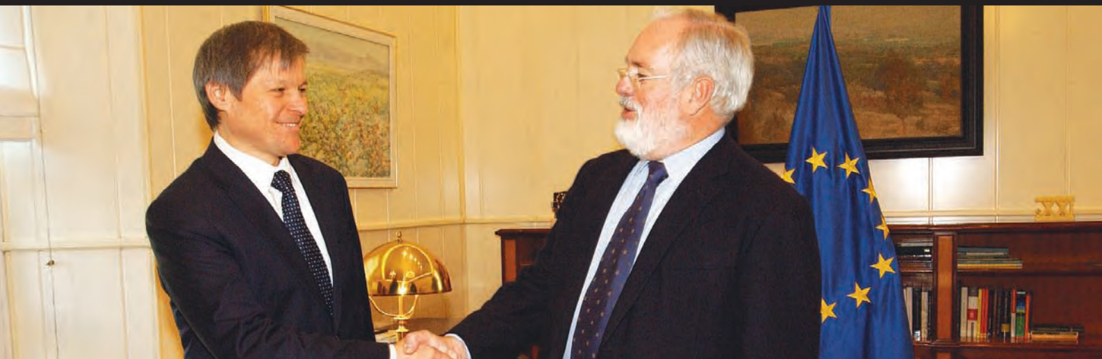
Dacian Ciolos, comisario europeo de Agricultura, y el homólogo español, Arias Cañete, en su visita a España