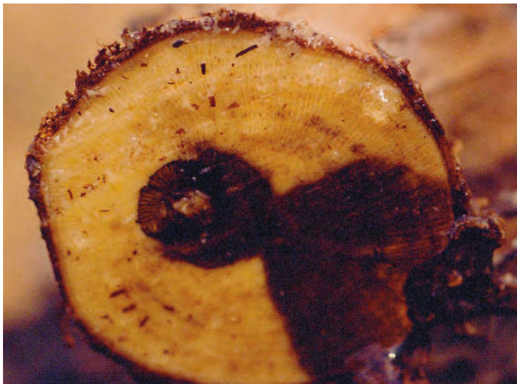
Chancro en corte de madera

nico y cancerígeno. Sin embargo, al tratarse de un producto que conseguía eliminar los síntomas externos de la enfermedad, su uso y abuso se generalizó en el campo español. Un solo tratamiento tras la poda y la brotación de yemas, repetido en un ciclo de 2-3 años, bastaba para controlar la enfermedad (Del Rivero y García Marí 1984, en González y Tello 2011). Debido a su extrema peligrosidad, tanto para el medio ambiente como para el hombre, el arsenito sódico se prohibió en Europa en 1991 y en España, Francia y Portugal en 2003. La prohibición de los tratamientos con arsenito sódico en el viñedo ha obligado al empleo de fungicidas que son menos eficaces (Graniti et al. 2000) haciendo que los ataques o afecciones de hongos de madera en vid sean más frecuentes.