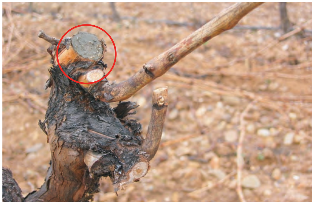
Aplicación de masilla en corte de poda

- Araña roja ( Panonychus ulmi Koch), observación de grietas y/o picaduras en la base de las yemas de los sarmientos.