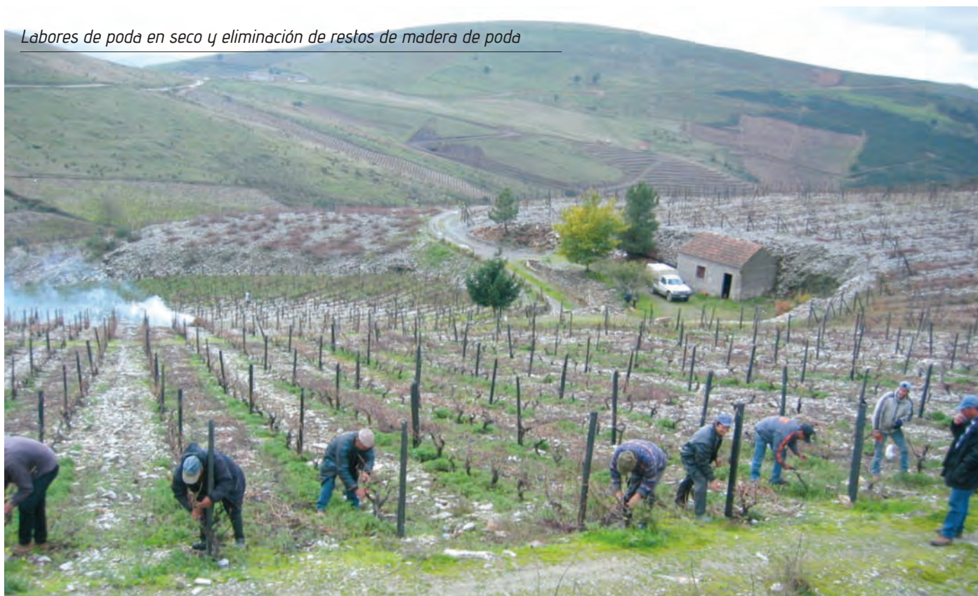
Labores de poda en seco y eliminación de restos de madera de poda

Gran parte de las posibles decisiones de las actividades y tratamientos que se deben llevar a cabo durante el periodo de reposo vegetativo de las cepas comienzan mucho antes, durante el ciclo vegetativo, y condicionan el siguiente. Por tanto, es esencial que el viticultor, durante la campaña, esté muy atento a las condiciones meteorológicas y al desarrollo de las plagas y enfermedades. Si por diversas circunstancias alguna afección no ha podido ser controlada, debe culminarse en la época de reposo vegetativo el control y la lucha con el fin de continuar con una estrategia de control y prevención en el siguiente ciclo vegetativo.