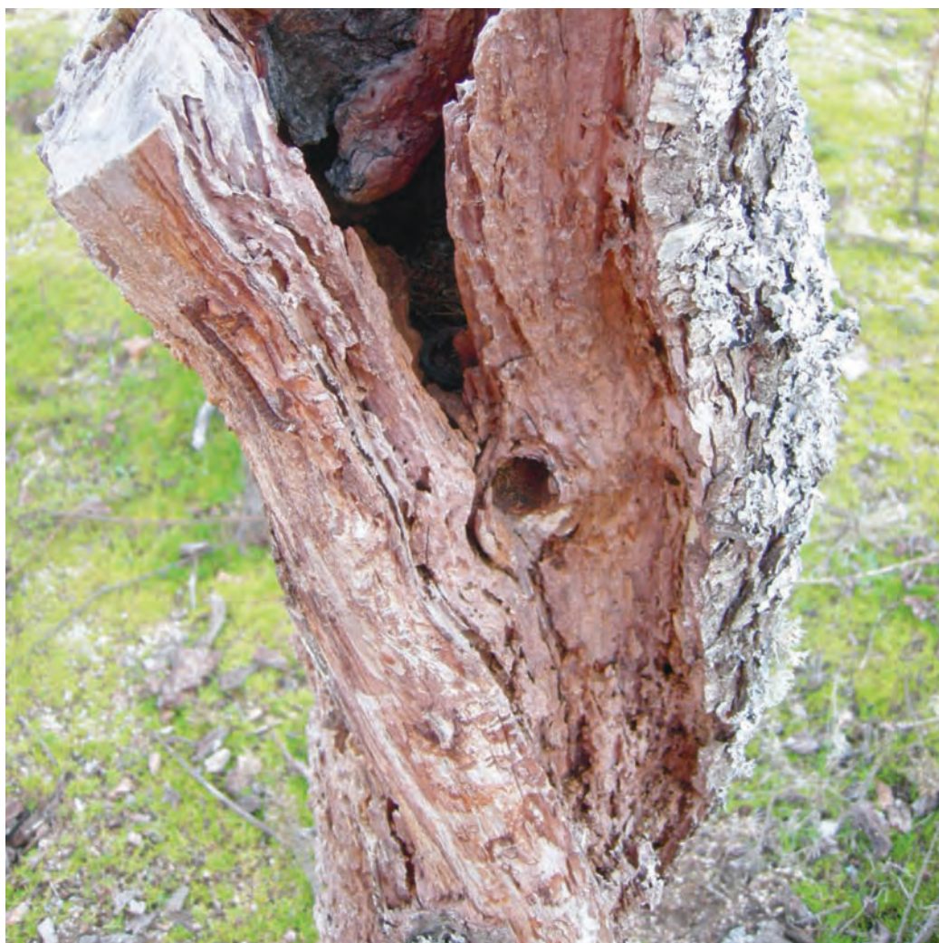
Tronco con galerías de termitas

García, E. Soler, J., Pérez, J.L. 1994. Ensayo de eficacia del producto Ciproconazol contra la yesca de la vid ( Stereum hirsutum Per. y Phellinus igniarius