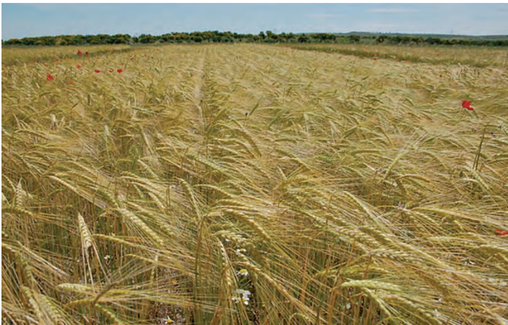
Parcela de cebada en ecológico perteneciente al ensayo de variedades y técnicas de siembra que se ha llevado a cabo durante cinco años en la finca Coto Bajo de Matallana

Son escasas las plagas y enfermedades que afectan al secano semiárido. Las más nombradas los últimos años han sido el topillo, la nefasia, y en los años de más precipitación, algún hongo como el Rynchosporium . Las soluciones arbitradas por la agricultura convencional han resultado de una utilidad dudosa y con claros efectos “colaterales” sobre el medio ambiente y la salud humana. Véase si no este párrafo de un folleto divulgativo de un organismo público: “Deben tenerse en cuenta los efectos negativos de estos tratamientos (contra la nefasia) como son la destrucción de la fauna útil, la generación de residuos, la aparición de resistencias y la contaminación am-