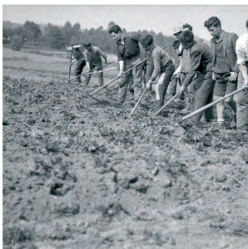
Labores de cultivo en patatas. A Coruña, 1963

El Grupo de Trabajo de Laboratorios de Diagnóstico y Prospecciones Fitosanitarias, creado en 1985, esta formado por los técnicos de los La-