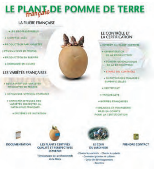
Catálogo francés de variedades de patata

En colaboración con la Filmoteca Española, el MARM ha iniciado en 2006, la creación de la Mediateca Digital, dentro la Plataforma de Conocimiento, que recupera joyas cinematográficas como la Charla cinematográfica sobre el escarabajo de la patata. ¡Pasen y vean!