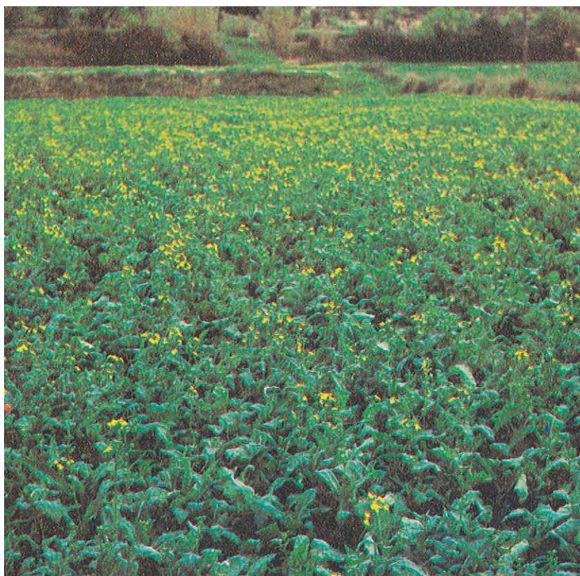
Plantación de colza para producción de biodiésel

El desarrollo del mundo moderno y su proceso industrial se ha basado en el aprovechamiento de combustibles fósiles, el carbón y el petróleo. Han contado a su favor que son de relativamente fácil obtención además de bajo costo de producción y fácil transporte. También ayudó la evolución de los motores de combustión interna que se orientó a la optimización y empleo de los diferentes derivados del petróleo.