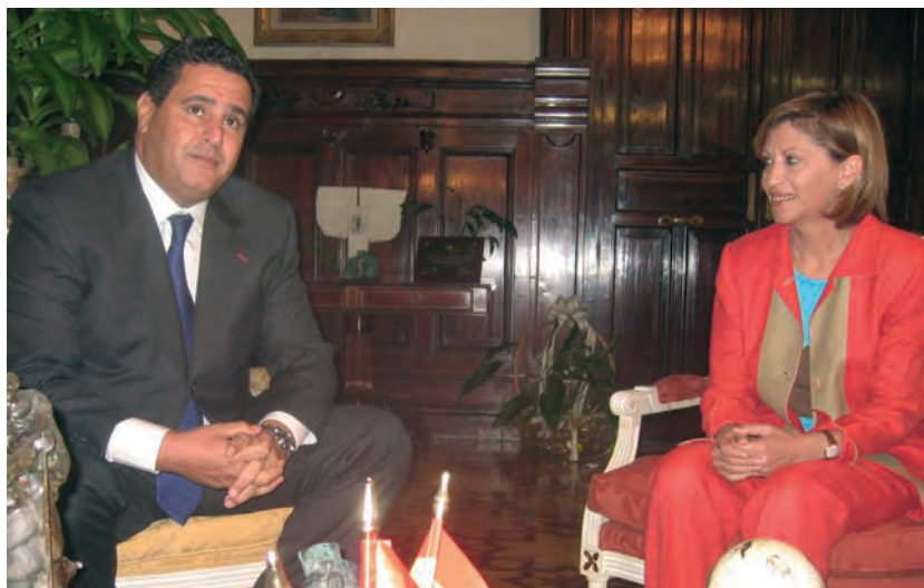
El Ministro de de Agricultura y Pesca Marítima de Marruecos, Aziz Akhannouch, (izda.) junto a su homóloga española, Elena Espinosa

Bruselas y Rabat han aprobado el pasado 13 de octubre el Estatuto de Asociación Avanzado, que abre una hoja de ruta para que en los próximos años Marruecos pueda alcanzar altos niveles de integración con la UE sin convertirse en Estado miembro. Organizaciones agrarias temen que la agricultura marroquí pueda acceder a los mismos fondos comunitarios que la española y una gran distorsión de la competencia en los mercados de frutas y hortalizas. No obstante, el campo marroquí puede ser objeto de inversión española.