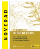
RECURSOS FITOGENÉTICOS J.I. Cubero, S. Nadal, Mª T. Moreno 192 páginas 15 Euros