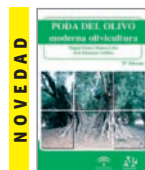
PODA DEL OLIVO (Moderna olivicultura) M. Pastor y J. Humanes 5ª Edición 376 páginas 30 Euros