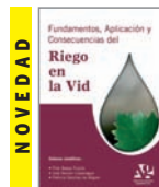
Fundamentos, Aplicaciones y Consecuencias del RIEGO EN LA VID P. Baeza Trujillo, J.R. Lissarrague, P. Sánchez de Miguel 264 páginas color 30 Euros