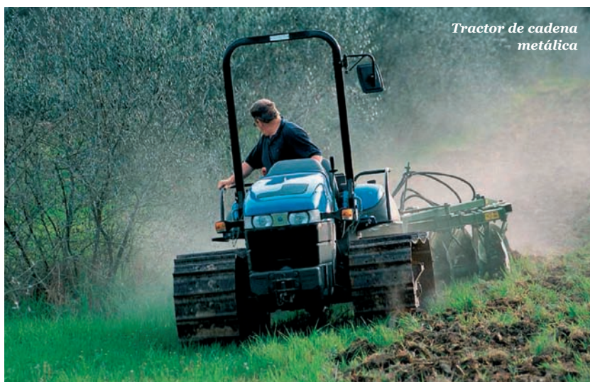
Tractor de cadena metálica

Dentro de esta labor está también el uso de la pala frontal, función popular asignado a los tractores en explotaciones ganaderas o en aquellas donde las labores de carga y descarga sea frecuente.