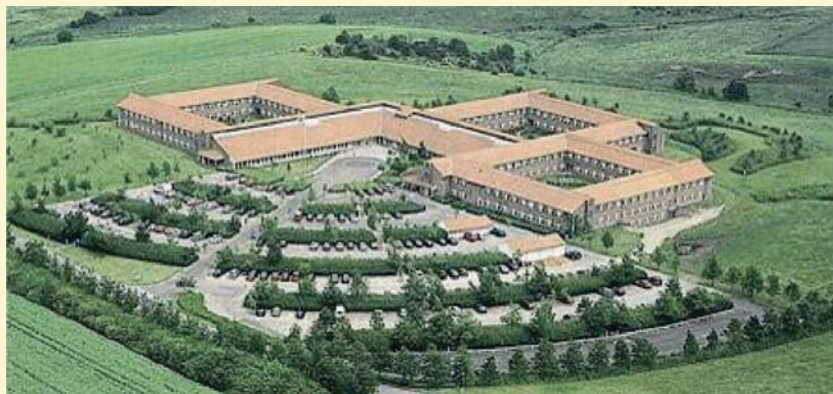
El Centro Nacional del Servicio de Asesoramiento Agrario danés tiene alrededor de 500 empleados y proporciona respaldo a 2.800 asesores en 54 centros consultivos locales

Dinamarca: el asesoramiento agrario lo llevan a cabo organizaciones privadas de agricultores. La más importante de ellas cuenta con unas oficinas centrales (con función de investigación y apoyo) y alrededor de 50 centros regionales que suministran el asesoramiento directamente al agricultor.