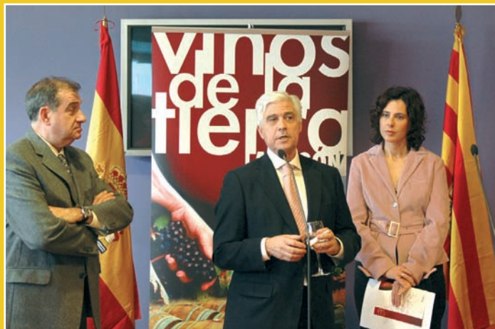
El consejero de Agricultura y Alimentación de Aragón, Gonzalo Arguilé en la presentación de la Asociación Vinos de la Tierra de Aragón.

La actual Ley de la Viña y el Vino, del año 2003, incluyó entre sus figuras de protección la denominación Vinos de la Tierra, que según el texto son aquellos a los que pueden "conferir características específicas" unas "determinadas condiciones ambientales y de cultivo".