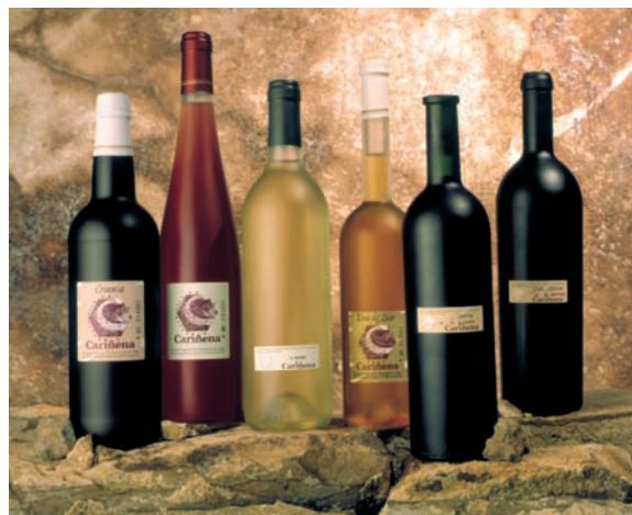
Botellas de la D. O. Cariñena

Esta vinculación parte de unas excelentes condiciones naturales para el cultivo de la vid. El Campo de Cariñena es una llanura cerrada en pleno valle del Ebro, con un clima frío y ventoso, pero donde las sierras colindantes favorecen la lluvia. En la llanura paralela a estas estribaciones, donde se sitúa el 80% de las plantaciones de vid, el clima se dulcifica; y los suelos son idóneos para el desarrollo de las cepas, pues aunque no necesitan mucha hu-