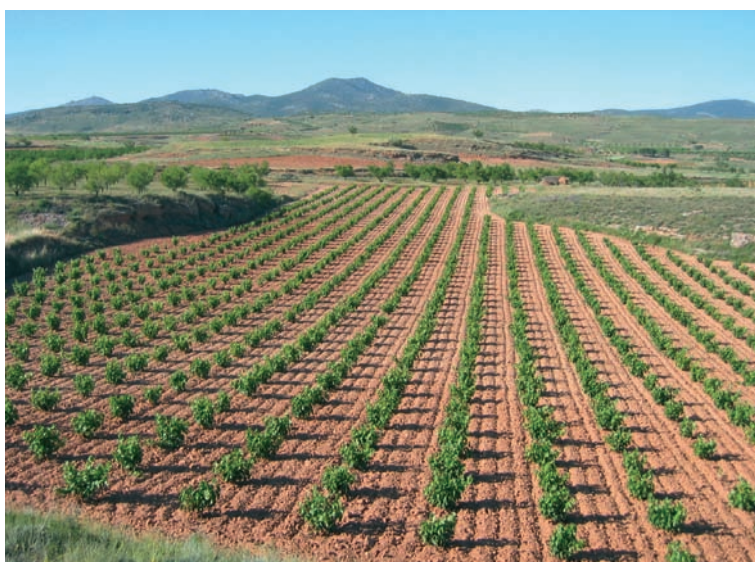
Campo de viñas de Calatayud

Y naturalmente, las visitas y degustaciones que ofrecen numerosas bodegas son otra de las mejores formas de vivir la cultura del vino en Aragón.