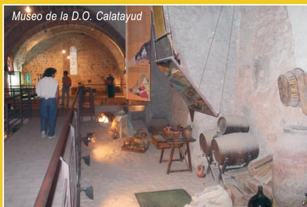
Museo de la D.O. Calatayud

Por su parte, los visitantes del Somontano pueden encontrar en el Complejo de San Julián y Santa Lucía,