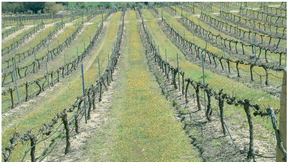
Campo de viñas de Somontano

Más importante es que entre la gama de vinos de Aragón se pueden encontrar vinos tintos, blancos y rosados; espumosos y dulces; vinos jóvenes, de crianza y reservas; vinos pensados para un público amplio y para conocedores; para el consumo diario y las grandes ocasiones. En suma, vinos para comprobar por qué Aragón no ha dejado de ser sinónimo de buen vino.