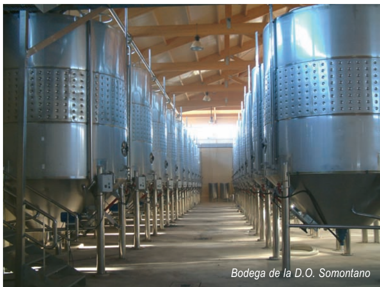
Bodega de la D.O. Somontano

la zona (parraleta, moristel, etc.), como otras muchas variedades de calidad (chardonnay, merlot, gewürztraminer).