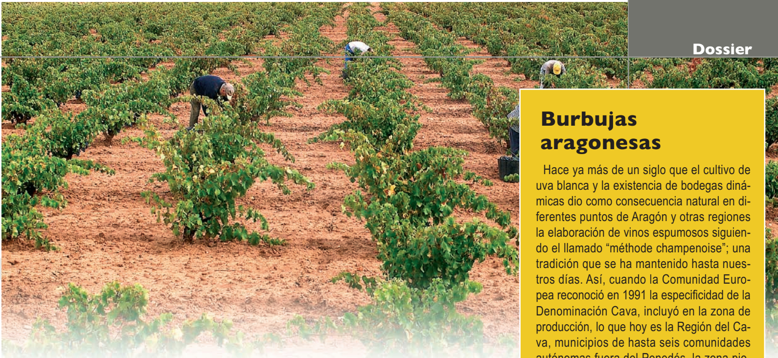
Trabajando los viñedos del campo de Borja

medad, son capaces de conservarla durante tiempo.