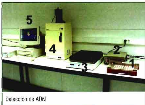
Detección de ADN