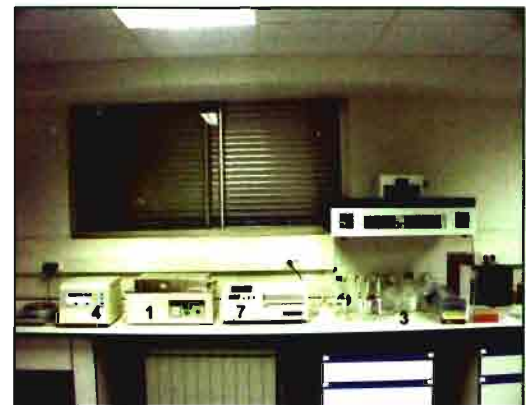
Extracción y cuantificación del ADN