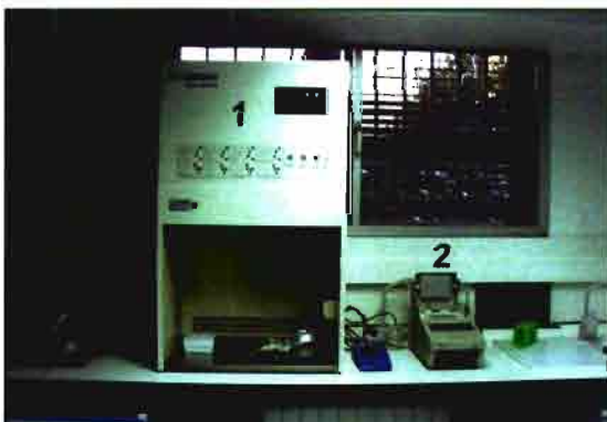
Amplificación del ADN