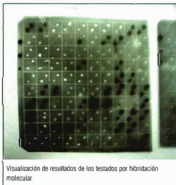
Visualización de resultados de los testados por hibridación molecular

Sobre las membranas se cargaron los ácidos nucleicos extraídos de las muestras y se fijaron con luz UV introduciéndolas en el transiluminador.