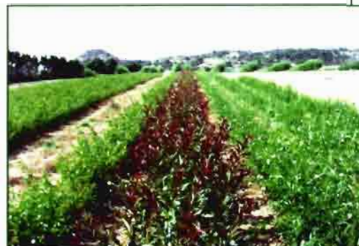
Vivero de Planta Madre de Base

En Aragón, el sector productor tiene una gran tradición y está compuesto por 57 viveristas registrados, con una producción media de 2.500.000 plantas, entre portainjertos y variedades, de las especies de pepita (Manzano, Peral, Membrillero), hueso (Melocotón, Nectarina, Albaricoquero, Ciruelo, Cerezo, Almendro) y Olivo.