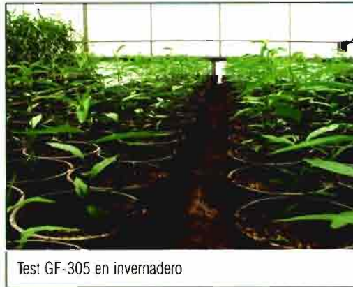
Test GF-305 en invernadero

El control sanitario se realiza mediante test de laboratorio ELISA, test biológico de invernadero (GF-305) y test leñosos de campo (Indexaje), sobre plantas e indicadores aprobadas y más recientemente a través de técnicas de biología molecular por hibridación molecular y PCR (Polymerase Chain Reaction).