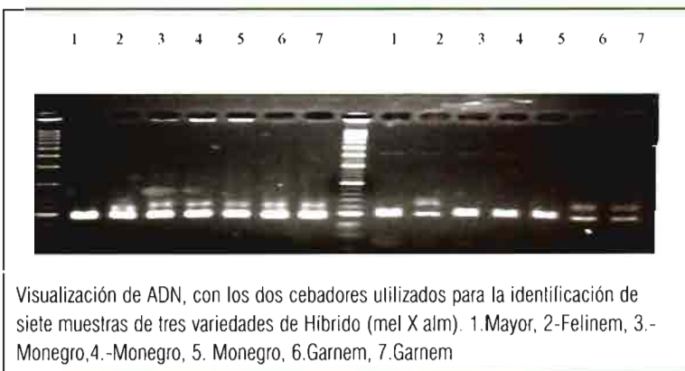
Visualización de ADN, con los dos cebadores utilizados para la identificación de siete muestras de tres variedades de Híbrido (mel X alm). 1.Mayor, 2-Felinem, 3.-Monegro,4.-Monegro, 5. Monegro, 6.Garnem, 7.Garnem