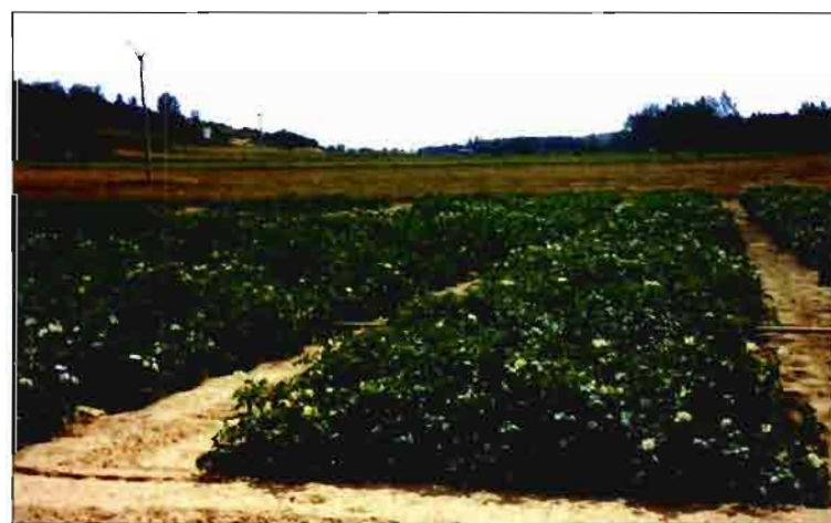
Campo Ensayos. Llanillo, 1999

Estos cuatro clones forman parte en 1.999 de una serie de campos más amplia de red exterior, al objeto de conocer su comportamiento en diferentes zonas. (Galicia, Rioja, Valladolid y Alava). Así, en la finca del S.I.D.T.A. de Zamadueñas se han plantado dos parcelas de ensayo: en la primera se encuentran estos cuatro clones de 5º año de APPACALE S.A. con testigos en cuatro repeticiones, y en la segunda parcela están los seis clones seleccionados de 4º año con testigos en tres repeticiones. Junto a estas parcelas, se encuentran plantadas 12 variedades comerciales que servirán para el programa de evaluación de calidad.