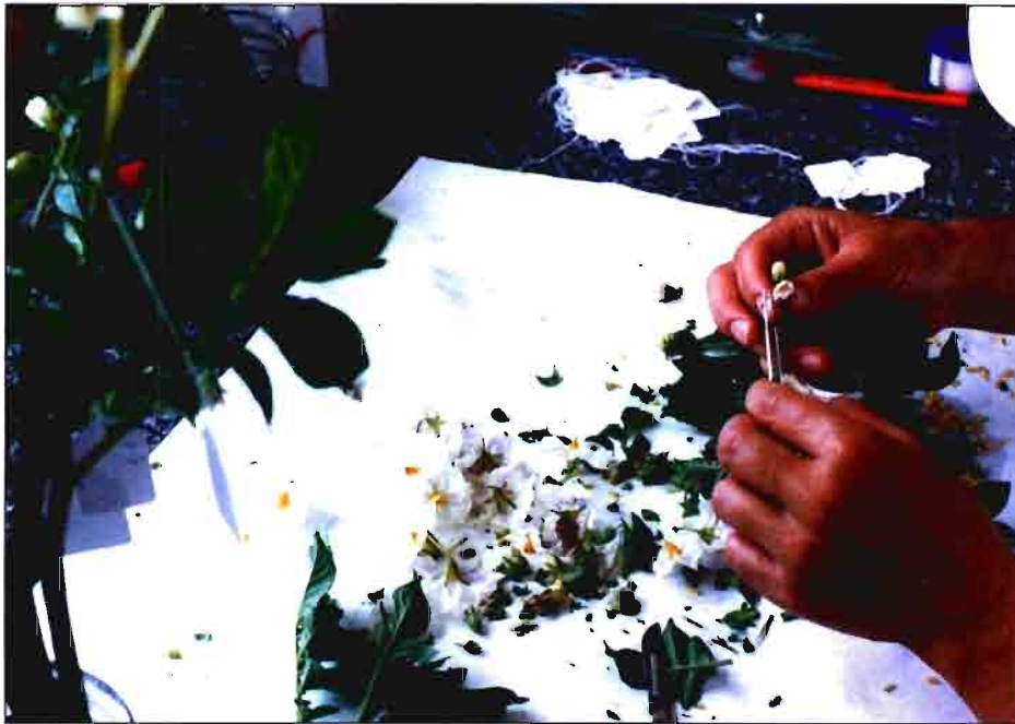
Castración de flores para realizar cruzamientos

El trabajo de I+D de APPACALE S.A. durante 1.998 tuvo como eje principal el programa de Mejora Genética de la