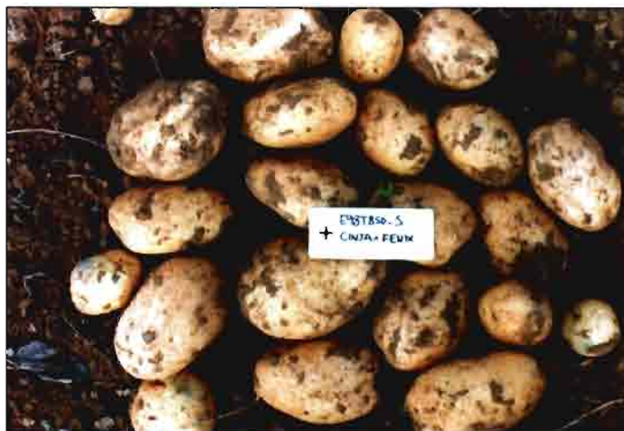
Clon de 5º año, 1999