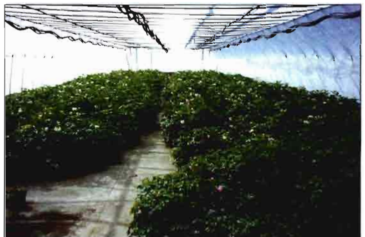
Clones año 0 en macetas

parcelas de cinco tubérculos de los distintos subprogramas como se muestra en el cuadro 1.