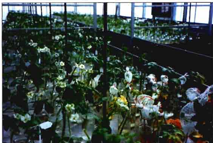
Tallos de flor en invernadero. Cuajado

calidad para industria de clones de APPACALE S.A.